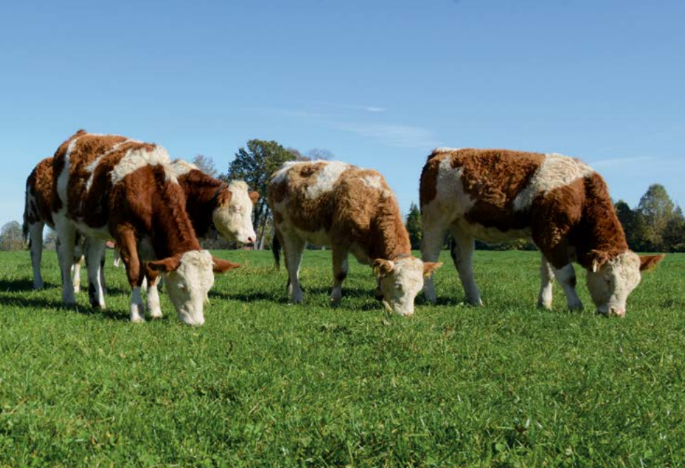
Ideal auch bei der Jungviehaufzucht: die Kurzrasenweide