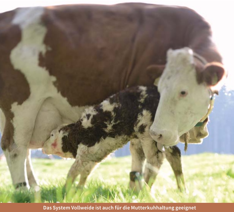
Das System Vollweide ist auch für die Mutterkuhhaltung geeignet