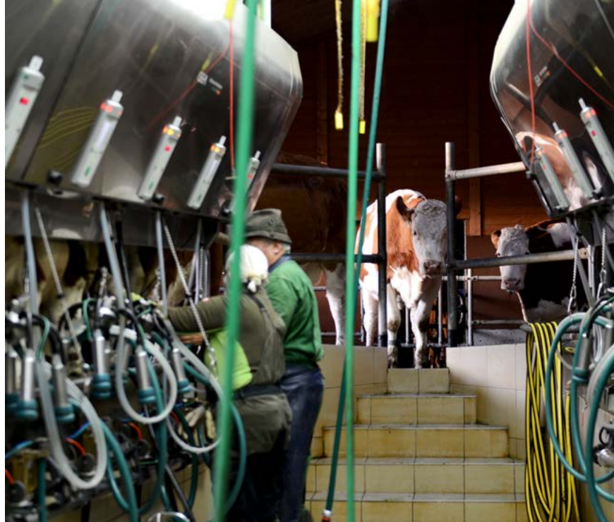
Wichtig bei Vollweide im Milchbetrieb: kurze Wege zur Melkanlage

Aufbauend auf dem vielbeachteten Projekt „Weidesanierung durch gezielte Beweidung“ untersuchte Siegfried Steinberger in den letzten Jahren die notwendige Anpassung der Almwirtschaft an den fortschreitenden Klimawandel. Die höhere durchschnittliche Jahrestemperatur führt zu einer Verlängerung der Vegetationsphase und einem stärkeren Wiesenwachstum. Das erlaubt nicht nur einen um bis zu drei Wochen früheren Auftrieb, sondern verlangt auch eine höhere Anzahl von Rindern auf der Alm.