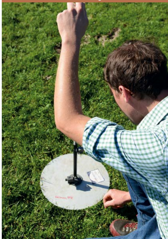
Nicht über acht Zentimeter – Messung der Aufwuchshöhe

»Zum Verhältnis konventioneller und ökologischer Weidehaltung lässt sich sagen: Bio muss Weidehaltung, aber Weidehaltung muss nicht Bio.«