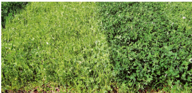
Sichtbar anders: links vorne eine ungedüngte und rechts vorne eine mit Schwefel gedüngte Parzelle.