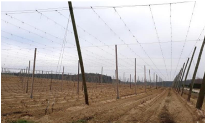
Abb. 1: Hopfengarten nach der Ernte (ohne Einsaat in der Fahrgasse)