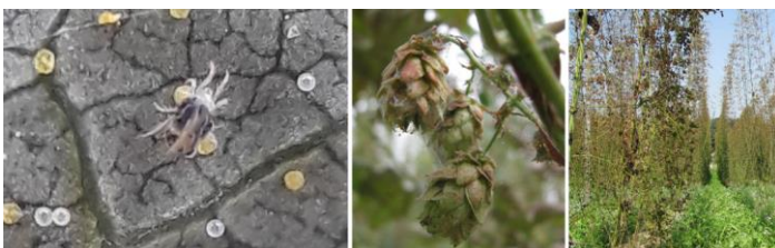
Abb. 4: Gemeine Spinnmilbe mit Eiern, Doldenbefall und extremes Schadbild

Werden heimische Raubmilben eingesetzt, zeigen sich deutlich geringere Schädigung der Hopfendolden als in der unbehandelten Kontrolle. Mit zugekauften Raubmilben fällt der optische Doldenschaden noch geringer aus. Bei Dolden aus der Praxis (mit Akarizid behandelt) schwankt die Schädigung stark, je nach der Verteilung des Pflanzenschutzmittels im Bestand. Die Wirkung eines Akarizids können Raubmilben bei starkem Befall jedoch nicht ersetzen.