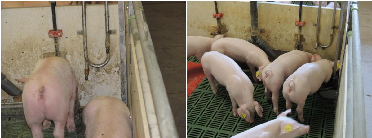
Bild 2: Ferkel an der Nippeltränke (links) bzw. an der Trogtränke (rechts)

Trogtränken verhindern Kannibalismus auch nicht bzw. führen zu „Raufereien“. Sie verursachen viel mehr Zusatzwasserverbrauch.