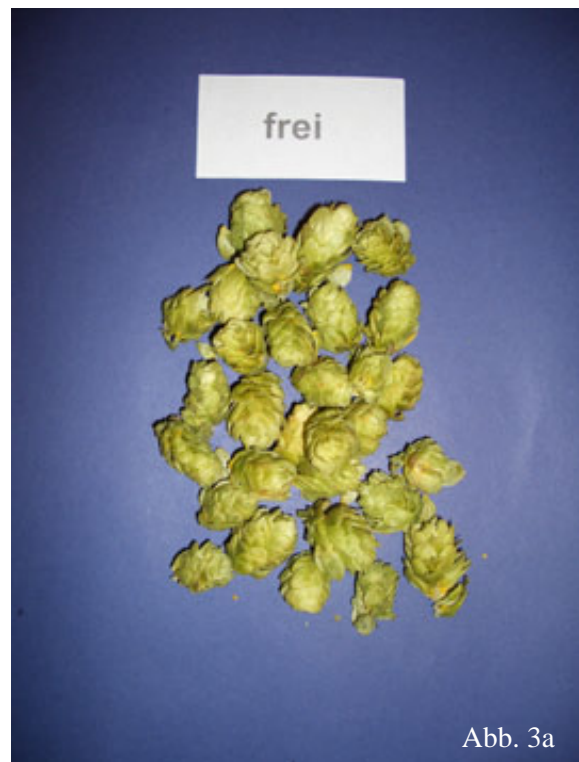
Abb. 3a: Hopfenmuster ohne Peronospora-Befall.