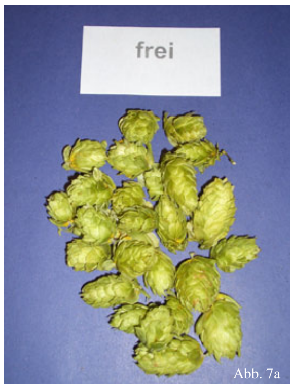
*****Abb. 9a: Hopfenmuster ohne Urkppo kdgp-Befall.