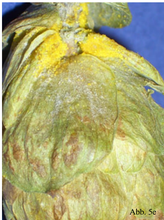
Abb. 5b – 5e: Hopfenmuster der Befallsklassen verursacht durch Echten Mehltau im atypischen Verlauf als Später Mehltau. (b) geringer Befall; (c) mittlerer Befall; (d) starker Befall; (e) starker Befall im Detail.