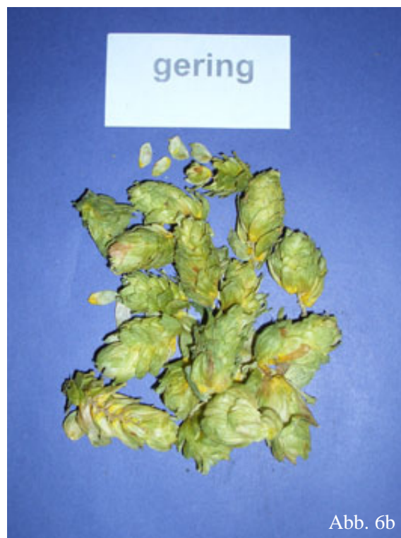
Abb. 6a - 6b: Hopfenmuster der Befallsklassen verursacht durch Hopfenblattläuse. (a) ohne Befall; (b) geringer Befall.