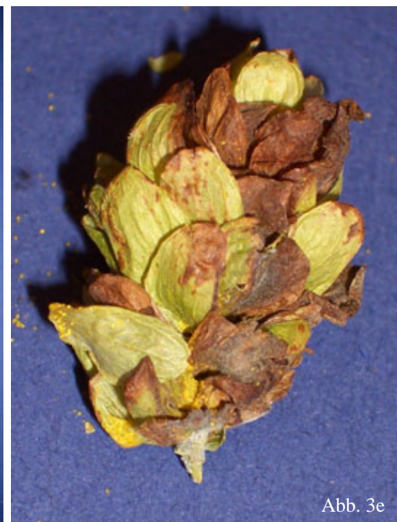
Abb. 3b - 3e: Hopfenmuster der Befallsklassen verursacht durch Peronospora . (b) geringer Befall; (c) mittlerer Befall; (d) starker Befall; (e) starker Befall im Detail.