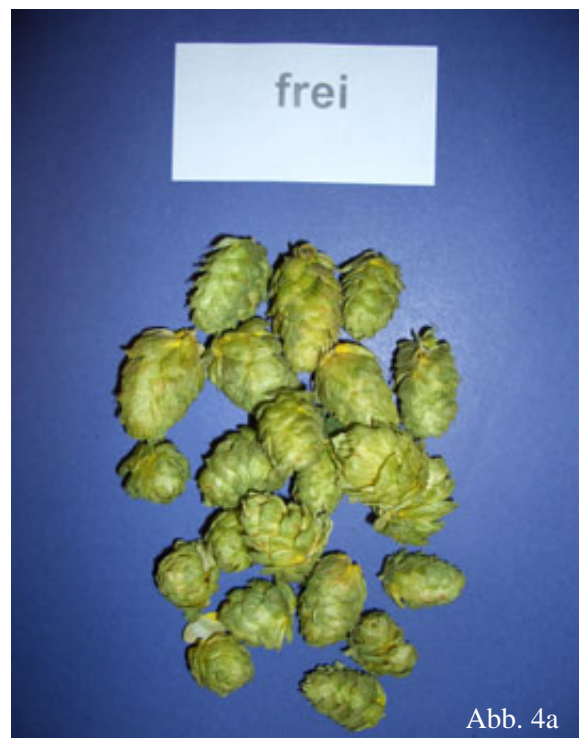
Abb. 4a: Hopfenmuster ohne Mehltau-Befall.