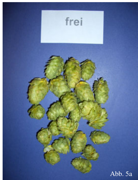
Abb. 5a: Hopfenmuster ohne Mehltau-Befall.