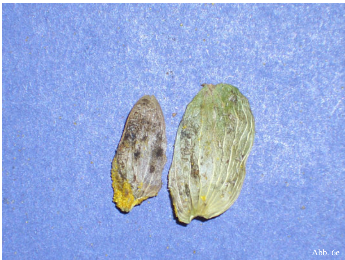
Abb. 6c - 6e: Hopfenmuster der Befallsklassen verursacht durch Hopfenblattläuse. (c) mittlerer Befall; (d) starker Befall; (e) starker Befall im Detail.