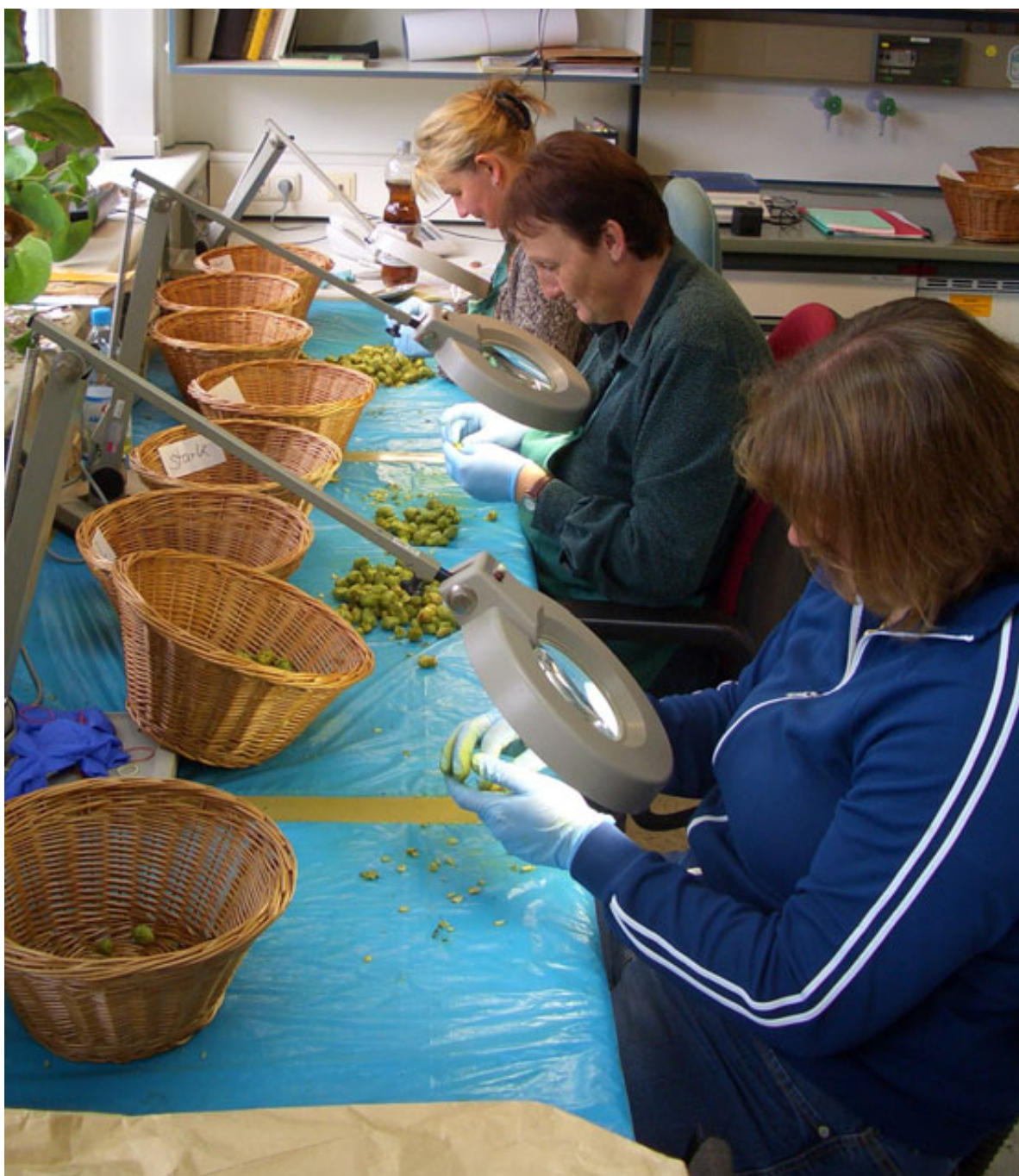
Abb. 2: Doldenbonituarbeit am Hopfenforschungszentrum Hüll im September 2009.

Die Einstufung des jeweiligen Befalls individueller Hopfendolden in vier verschiedene Klassen – kein, schwacher, mittlerer und starker Befall – erfolgt dabei am Hopfenforschungszentrum des Institutes für Pflanzenbau und Pflanzenzüchtung der Bayerischen Landesanstalt für Landwirtschaft in Hüll durch ein routiniertes Team hervorragend eingearbeiteter Mitarbeiter (Abb. 2). Bislang existierten jedoch noch keine schriftlich festgelegten Richtlinien, die diese jeweils vier Befallsklassen für die wichtigsten und somit häufig zu bewertenden Krankheiten und Schädlinge definieren. Um dieses Manko zu beseitigen, wurden während der Versuchsernte 2009 die vier Befallsklassen für Peronospora , Echten Mehltau, Hopfenblattlaus und Gemeine Spinnmilbe exakt auch in Worten festgelegt. Diese Definitionen der Befallsklassen sollen zukünftig als Richtlinien für die Doldenbonitur von Trockenhopfen dienen.