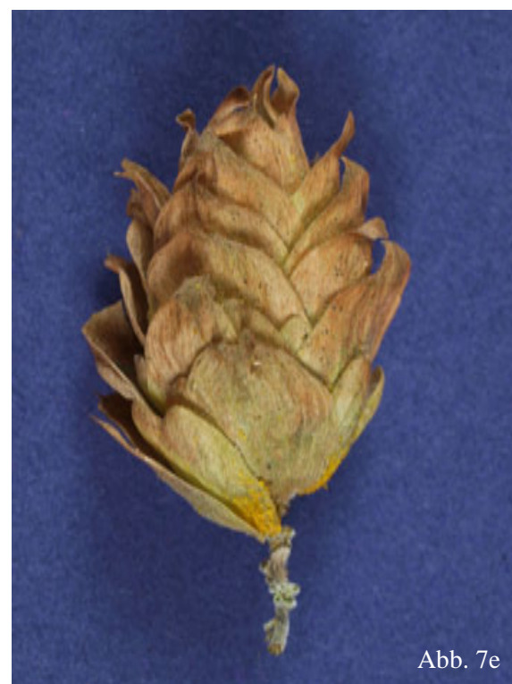
Abb. 7b - 7e: Hopfenmuster der Befallsklassen verursacht durch Spinnmilben. (b) geringer Befall; (c) mittlerer Befall; (d) starker Befall; (e) starker Befall im Detail.