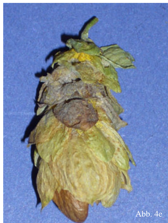
Abb. 4b - 4e: Hopfenmuster der Befallsklassen verursacht durch Echten Mehltau im typischen Verlauf. (b) geringer Befall; (c) mittlerer Befall; (d) starker Befall; (e) starker Befall im Detail.