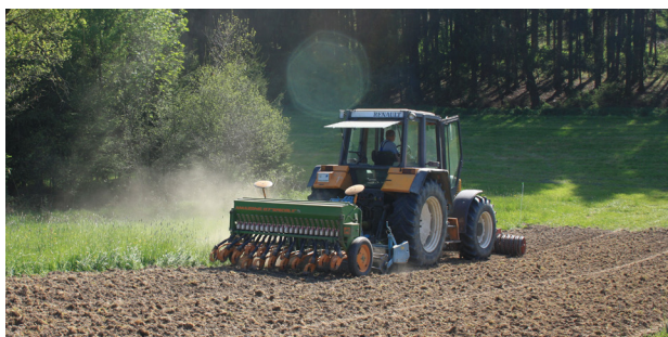
Abb. 6: Streifenweise Neuansaat mit der Drillmaschine