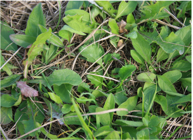
Abb. 7: Margerite, Flockenblume und Löwenzahn wachsen aus dem übertragenen Mahdgut auf einer Empfängerfläche heraus