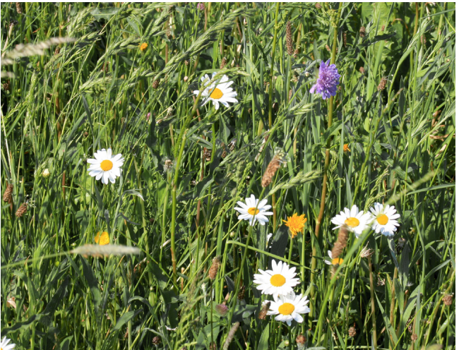
Abb. 8: Blühende Margeriten und Witwenblumen auf einer Empfängerfläche ein Jahr nach der Mahdgutübertragung