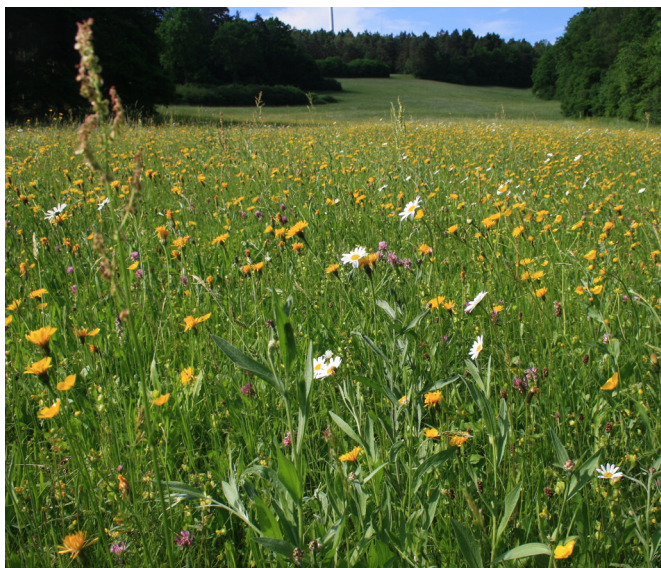
Abb. 1: Artenreicher Pflanzenbestand einer Spenderfläche

Im Projekt „Transfer – Artenanreicherung im Wirtschaftsgrünland“ wurde getestet, wie Landwirte mithilfe von Mahdgutübertragungen oder partiellen Neuansaat typische Wiesenarten auf solche Flächen übertragen können und somit deren Wert in der Kulturlandschaft steigern.