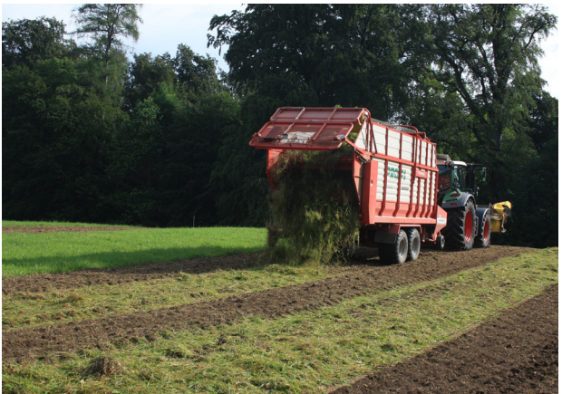
Abb. 5: Verteilen des geernteten Mahdguts auf den Streifen