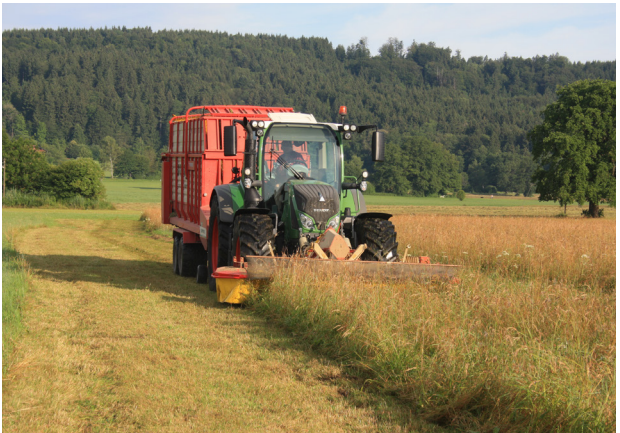
Abb. 4: Mähen der artenreichen Spenderfläche zum Zeitpunkt der Samenreife