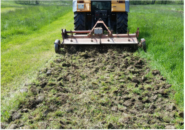
Abb. 3: Streifenweises Entfernen der Grasnarbe mit einer Fräse