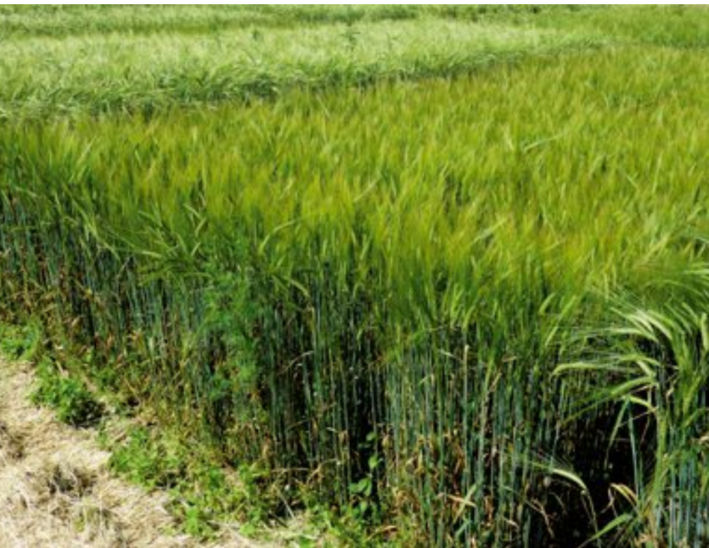
Verschiedene Braugersten in Viehhausen, 2010; mittig Marthe, links Union, rechts vorne am Rand Aura

Bayerische Landesanstalt für Landwirtschaft E-Mail: peer.urbatzka@lfl.bayern.de