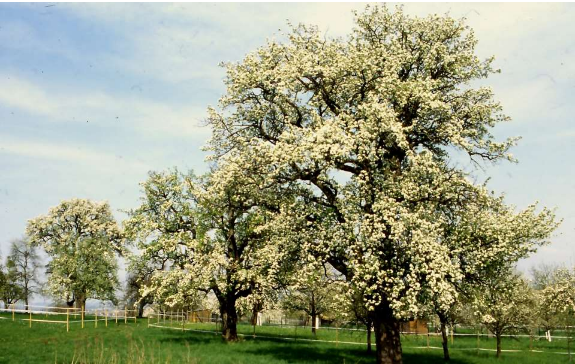
Palmischbirne in Blüte