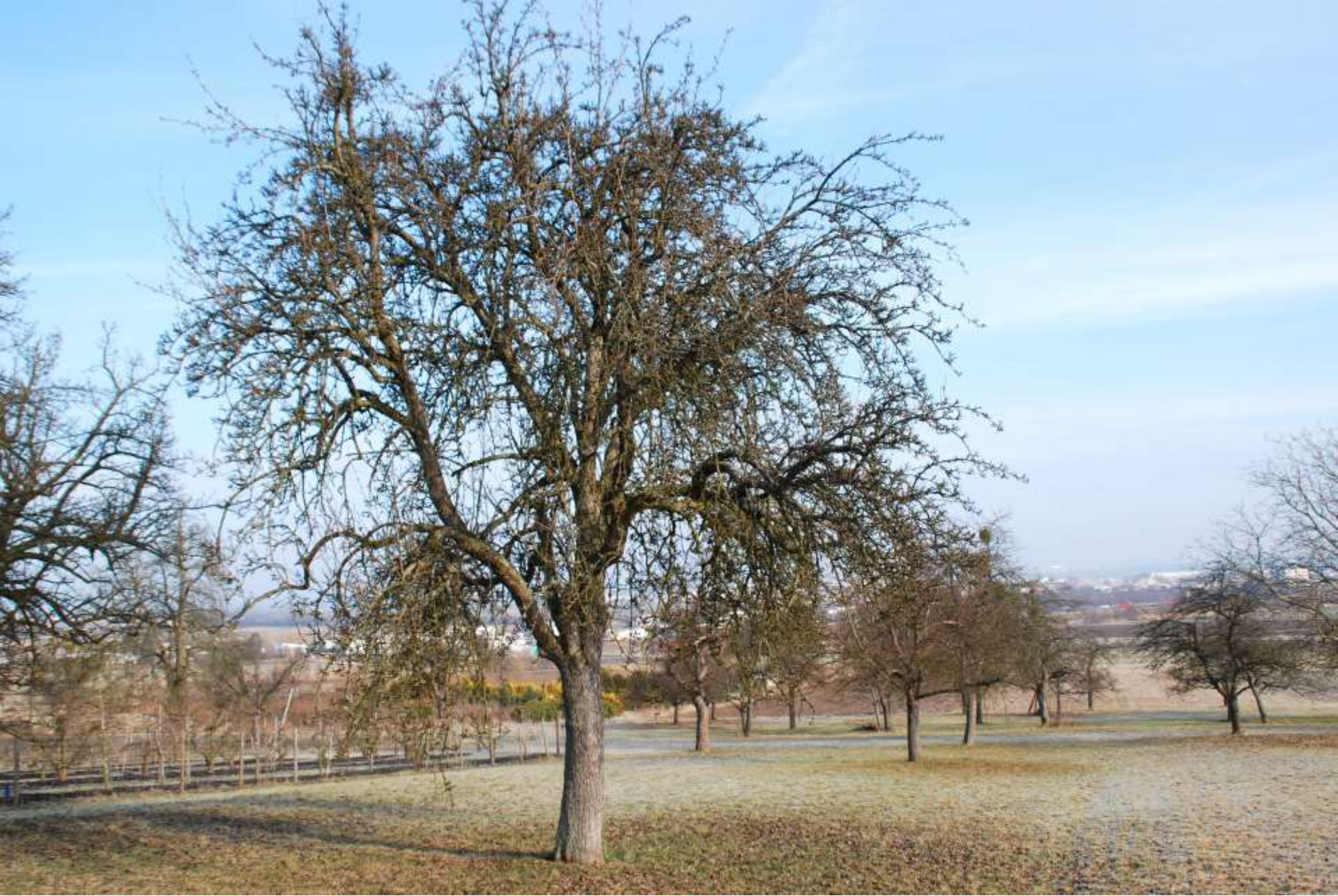
Baum der Sommermuskatellerbirne