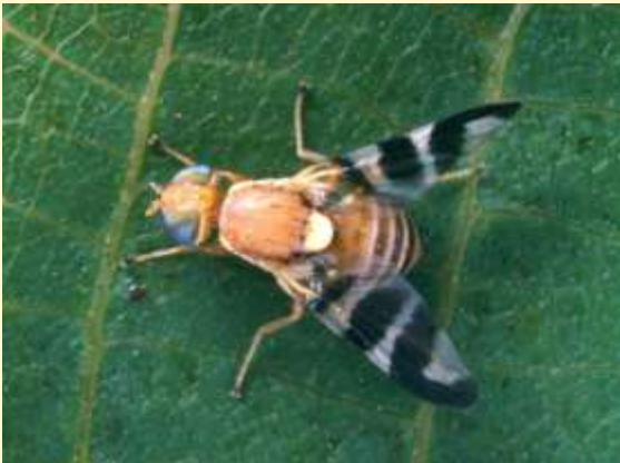
Walnuss-Fruchfliege ( Rhagoletis completa )