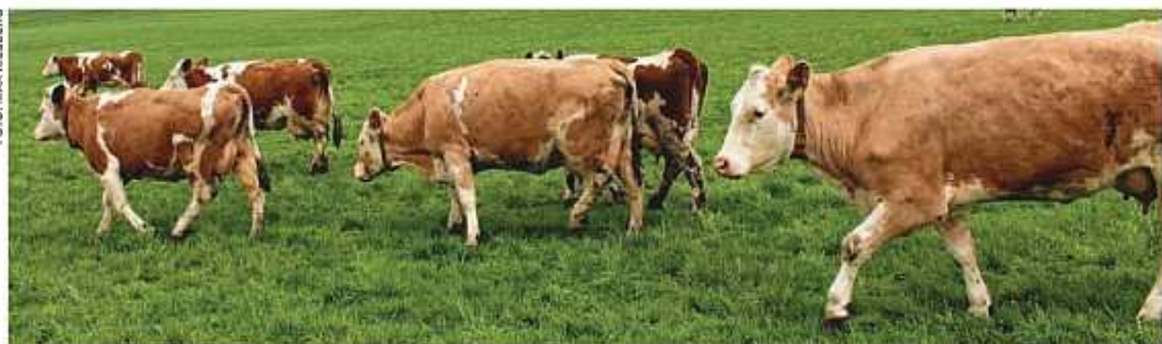
Regelmäßige Gangbeurteilung, auf der Weide oder im Stall, ist wichtig, um Lahmheiten früh zu erkennen.