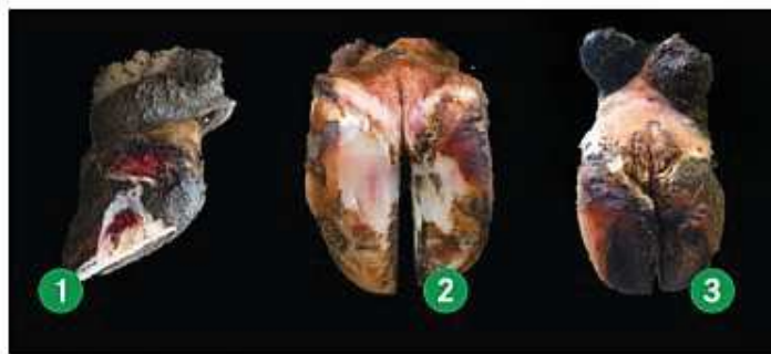
Krankheitsbefunde an Rinderklauen: 1. Eine kleine Läsion auf der weißen Linie verbirgt eine Entzündung der Lederhaut, hier mit Hohlräum bis zum Kronsaum. 2. Sohlenblutungen an der Außen- und Innenklau einer Hintergliedmaße 3. Dermatitis digitalis.

In der aktuellen Studie über Klauengesundheit und automatische Lahmheitserkennung an der LfL wurden Tiere, die sechs aufeinanderfolgende Wochen als „verdächtig“ (Locomotionscore 2) eingestuft wurden, mit einer Klauenabdruckzange auf Schmerzhaftigkeit in den Klauen untersucht. Es wurden 80 Fälle auf diese Art und Weise überprüft und