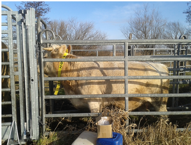
Abbildung 1: Kuh mit Halsband Nr. 02 im Fangstand vor der Auslesung des Collars

In drei vierwöchigen Perioden im Winter 2015/16 wurden vier Kühe mit einem Telemetriesystem der Firma Vectronic Aerospace GmbH, Berlin ausgestattet. Mittels GPS-Halsbändern wurde die Bewegungsaktivität der Mutterkühe registriert. Die Daten wurden in einem 5-Minuten-Intervall über den Tag- und Nachtzeitraum aufgezeichnet. Das Auslesen der Daten erfolgte mit Hilfe der Software GPS Plus X 1.1.1 der Firma Vectronic Aerospace GmbH.