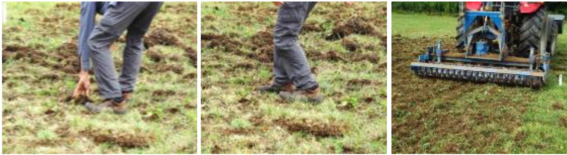
Abb. 1: Einebnung des künstlichen Wildschweinschadens per Hand und Fuß (links+mitte) oder per Kreiselegge (rechts)

Nach Einebnung des Schadens erfolgte die Aussaat des Saatgutes per Hand. Mit einer Walze wurde anschließend der Kontakt zwischen Samen und Boden hergestellt und der Boden weiter eingeebnet. Auch die Varianten der Selbstberasung wurden gewalzt. Für den Winter wurde der Versuch mit einem Elektrozaun umzäunt, um neue Wildschweinschäden zu verhindern. Im April 2019 erfolgte nach Zaunabbau eine unabgesprochene Striegelung der gesamten Mähwiese inklusive der Versuchsflächen durch den Landwirt, bei der es leider zu neuen, großen Lücken im Versuch kam.