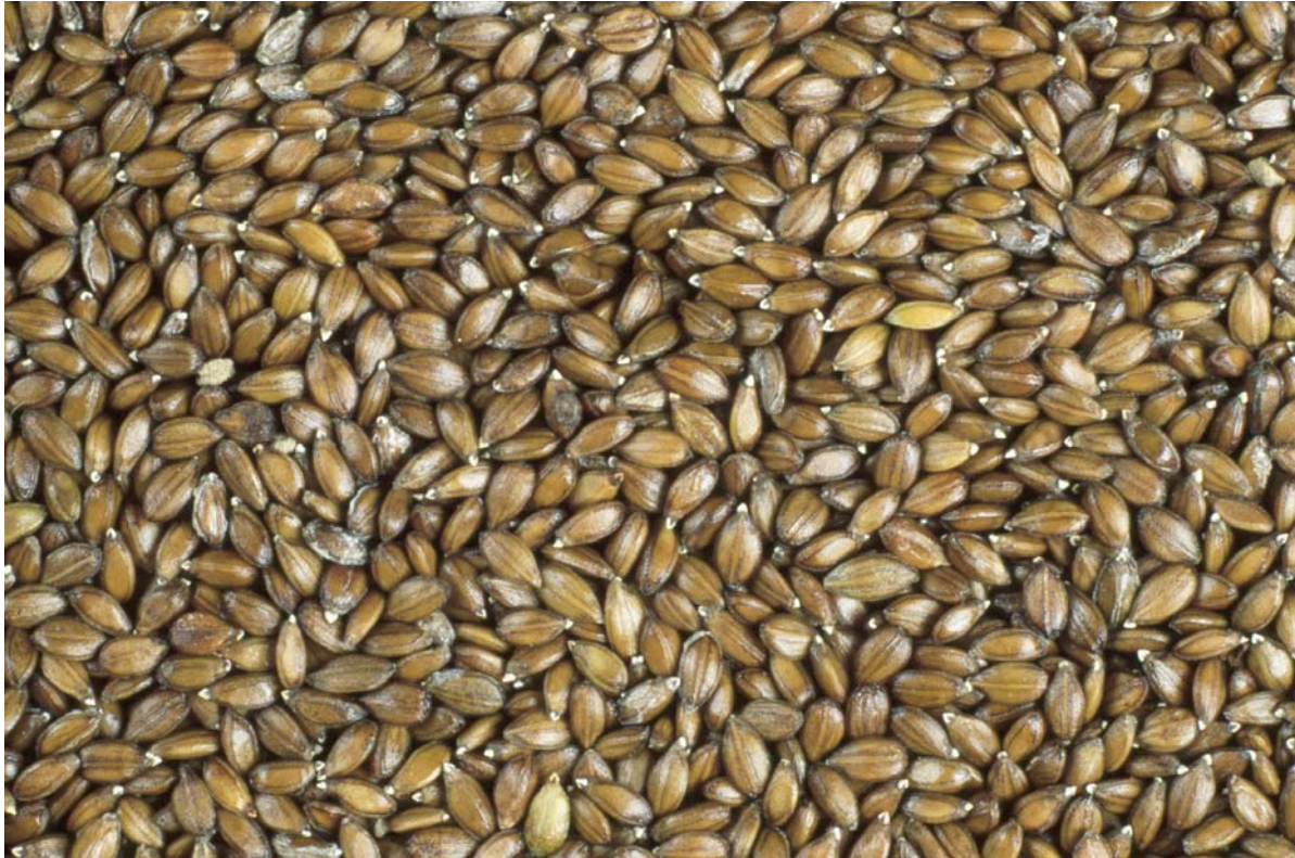
Abb. 1: Die Tausendkornmasse der Samen liegt bei 0,6 bis 0,9 g