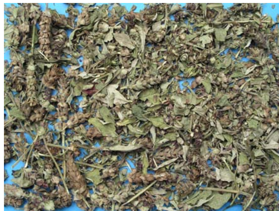
Abb. 8: Zerkleinerte Droge von Prunella vulgaris – blühende Kurztriebe