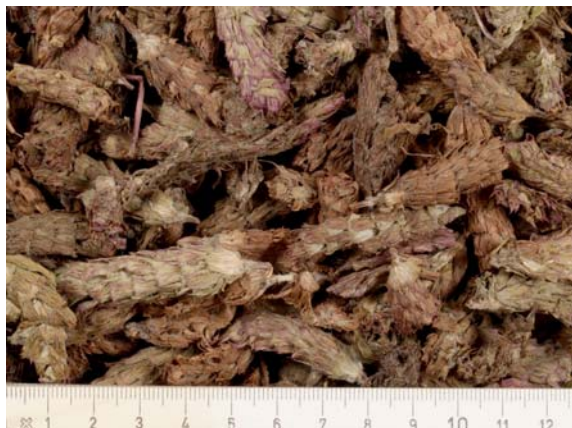
Abb. 7: Blütenähren-Droge von Prunella vulgaris