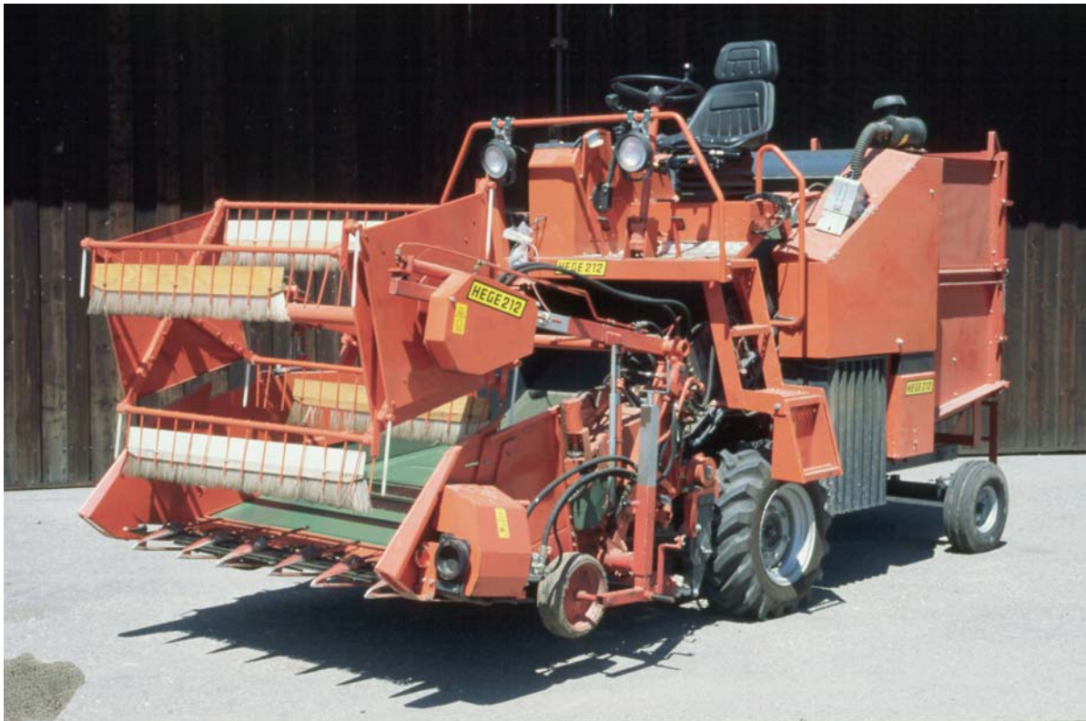
Abb. 5: Spezieller Grünguternter für Heil- und Gewürzpflanzen

Grundsätzlich ist ein Feldanbau von Prunella vulgaris mit maximal zweijähriger Nutzung (s. Kap. „Boden und Klimaansprüche“) unter hiesigen Standortbedingungen gut möglich. Aus Gründen der Ertragssicherheit ist die Pflanzkultur zu bevorzugen, obwohl auch bei der Drillsaat gute Erträge erreicht werden können (s. Tab. 2). Im Hinblick auf eine Erntemechanisierung erscheint aber nur die Produktion von blühenden Kurztrieben ökonomisch sinnvoll , sofern sich dafür Abnehmer finden. Dabei kann in der Praxis mit Erträgen von durchschnittlich 15 - 30 dt/ha Kurztrieb-Droge pro Anbaujahr gerechnet werden.