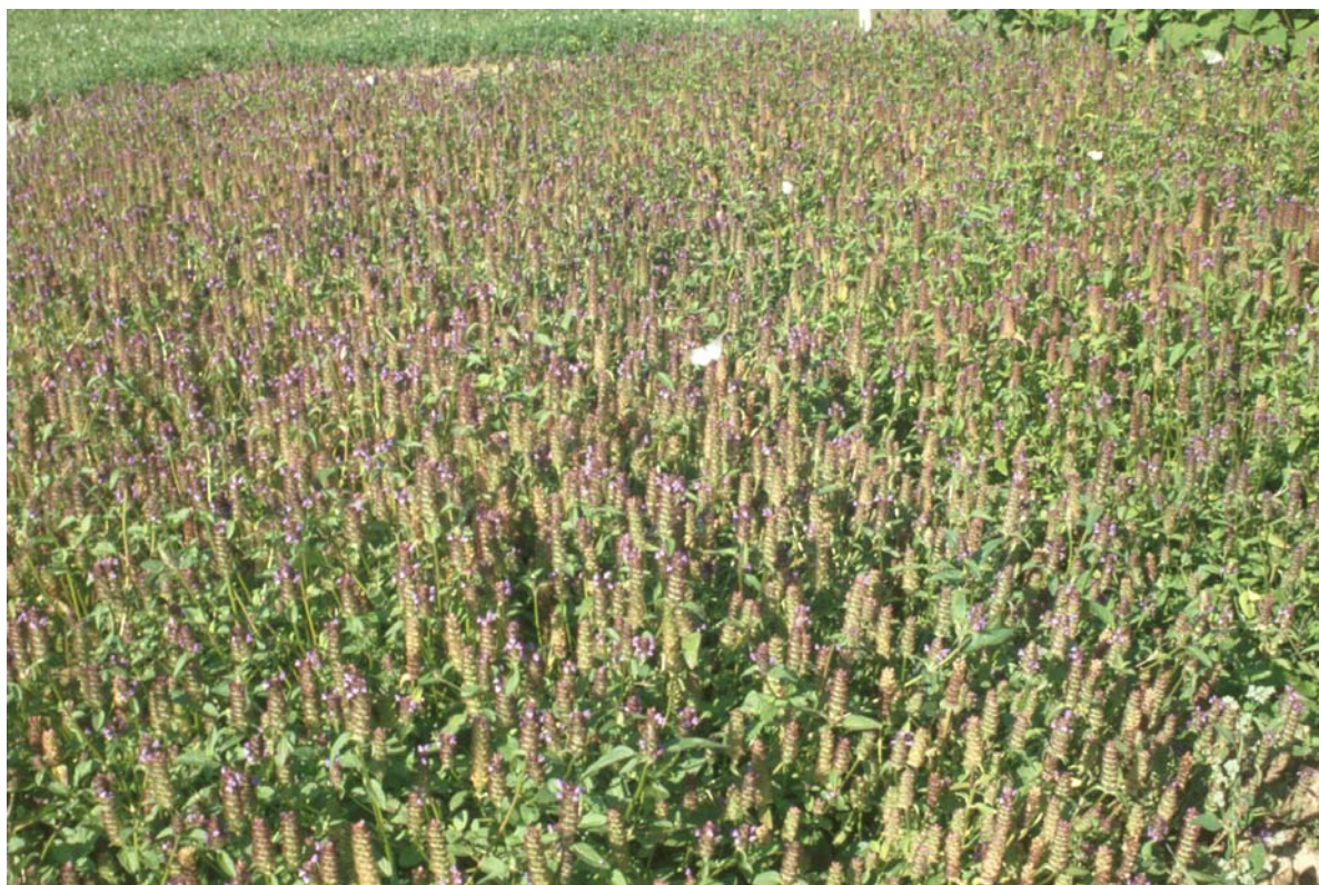
Abb. 6: Erntereifer Bestand von Prunella vulgaris

Anschließend wird zügig bei Temperaturen von etwa 50 °C am Erntegut und hohem Luftdurchsatz getrocknet. Erwünscht sind acht bis zehn Prozent Restfeuchte, die erreicht sind, sobald das Erntegut rascheltrocken ist und die getrockneten Stängelstücke glatt durchbrechen. Je nach Trocknungssystem dauert dieser Vorgang acht bis 30 Stunden. Die Trocknung kann in Kasten- oder Etagentrocknern, am besten auf – allerdings sehr teuren – Mehrbandtrocknungsanlagen, durchgeführt werden.