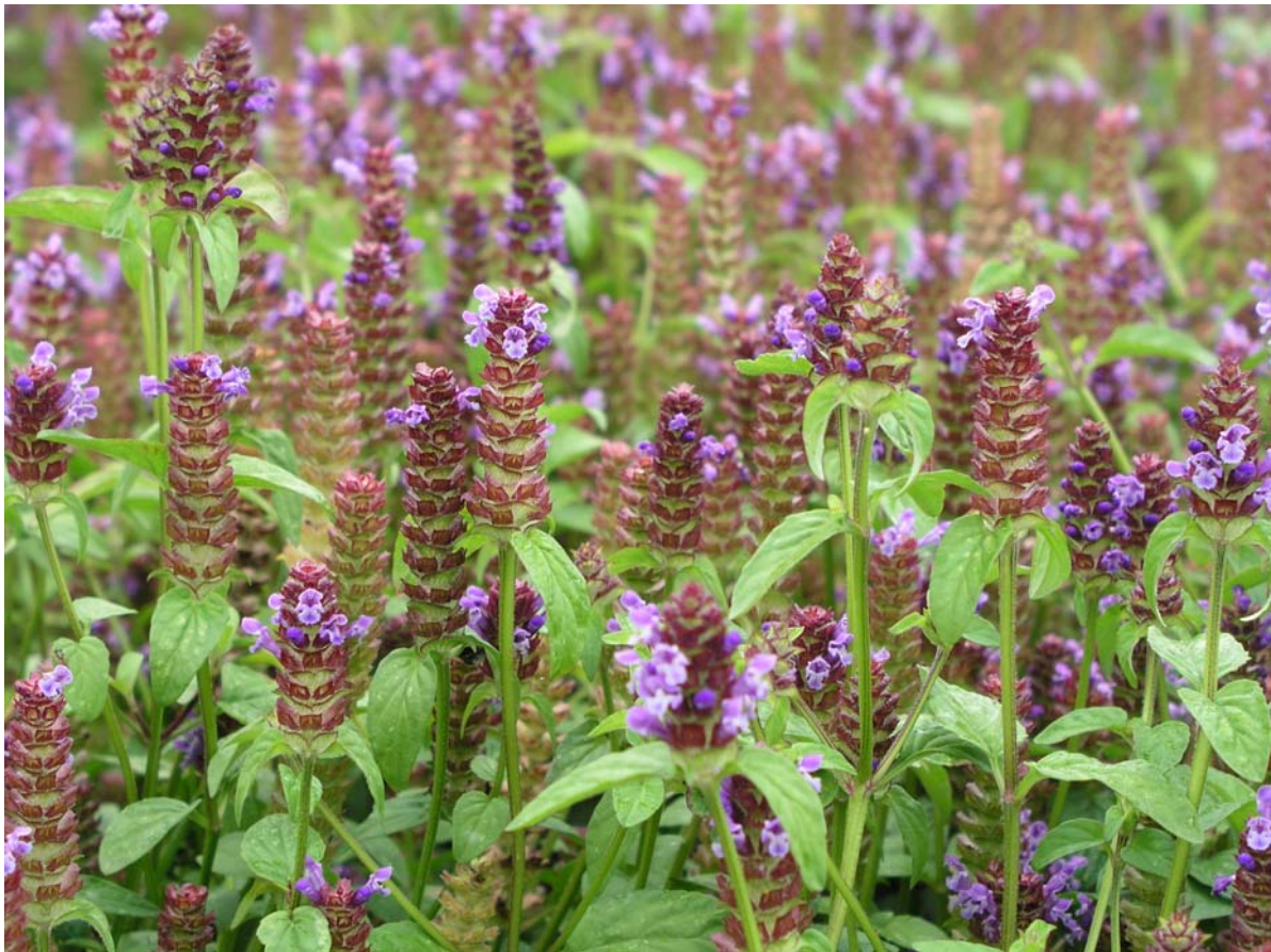
Abb. 4: Bestand bei beginnender Abblüte kurz vor der Ernte

Bisher gibt es keine Technologie, allein die „Blütenähren“, wie sie bisher vom Chinesischen Arzneibuch verlangt werden, zu gewinnen mit Ausnahme des viel zu kostenaufwändigen Handpflückens . Wegen des ungleichmäßigen Blühhorizontes sind mit den üblicherweise eingesetzten Erntemaschinen für Krautfrüchte (s. Abb. 5) nur blühende „Kurztriebe“ in einer Gesamtlänge bis zu etwa 15 cm zu gewinnen. Diese enthalten neben der Blütenähre noch ein Stück Stängel sowie einige Laubblätter. Verschiedene Anbautermine im Frühjahr und Sommer, unterschiedliche Standjahre der Kultur oder die Durchführung eines „Schröpfschnittes“ bei Blühbeginn führten zu keiner Besserung. Ein in der Blütenebene gleichmäßig hoher Bestand könnte nur durch züchterische Maßnahmen erreicht werden, wie sie bisher aus Kostengründen noch nicht durchgeführt worden sind. Versuche zum Schneiden und Separieren des Erntegutes vor oder nach der Trocknung in kommerziellen Aufbereitungsanlagen für Blattfrüchte wie Petersilie, Dill oder Liebstöckel blieben ebenfalls erfolglos.