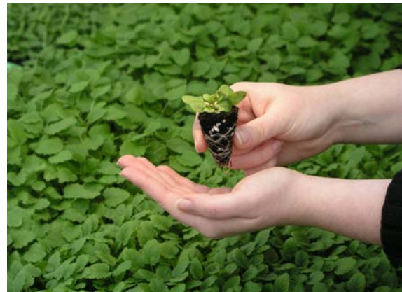
Abb. 3: Gut durchwurzelter Wurzelballen