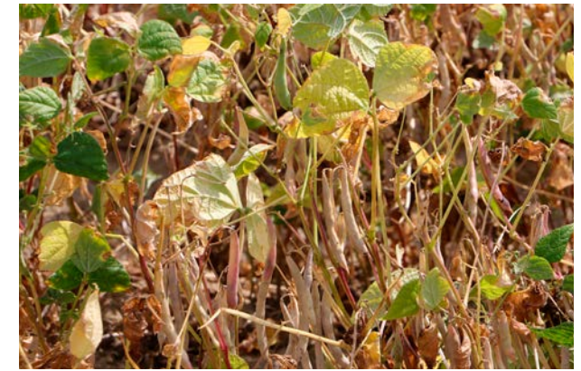
Abreifende Pflanzen der Trockenbohne „Black Turtle“

Phaseolus-Bohnen können von Viren (z. B. gewöhnliches Bohnenmosaik-Virus, Übertragung durch Insekten, Maschinen) und Bakterien (z. B. Xanthomonas, samenbürtig, Pseudomonas) befallen werden. Wichtig ist, nur gesundes Saatgut zu verwenden. Wie alle Leguminosen sind sie anfällig für bodenbürtige Pilz-Krankheiten, wie verschiedene Fusarium-Arten. Eine Anbaupause von mindestens vier Jahren ist empfehlenswert, um das Risiko von Fruchtfolgekrankheiten zu minimieren. Nach der Ernte sollte auf Käferbefall im Erntegut geachtet werden.