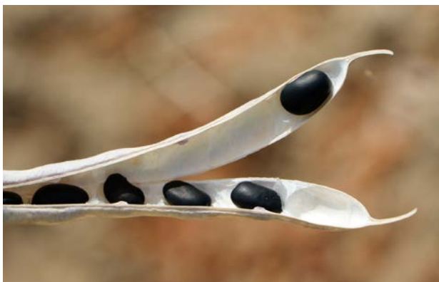
Trockenbohnen der Sorte „Kleine Schwarze“