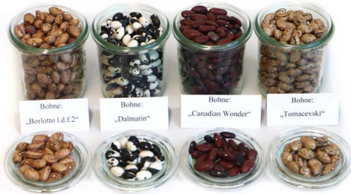
Verschiedene Trockenbohnen Sorten

Die Phaseolus-Buschbohne stammt ursprünglich aus Amerika. In einigen Ländern Süd- und Mittelamerikas zählt sie zu den Grundnahrungsmitteln. In Deutschland werden Phaseolus-Bohnen vor allem zur Grünernte angebaut. Der Anbauumfang als Trockenbohne zur Druschernte ist bisher sehr gering. Es gibt eine Vielzahl an farblichen und geschmacklichen Ausprägungen, z. B. die Kidneybohne oder die in Italien verbreitete Borlottibohne.