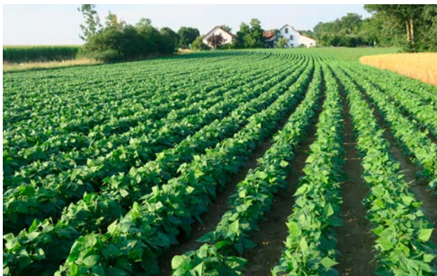
Buschbohnenbestand kurz vor dem Reihenschluss