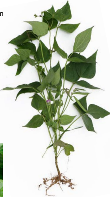
Blüte und Pflanze der Buschbohnenart Black Turtle