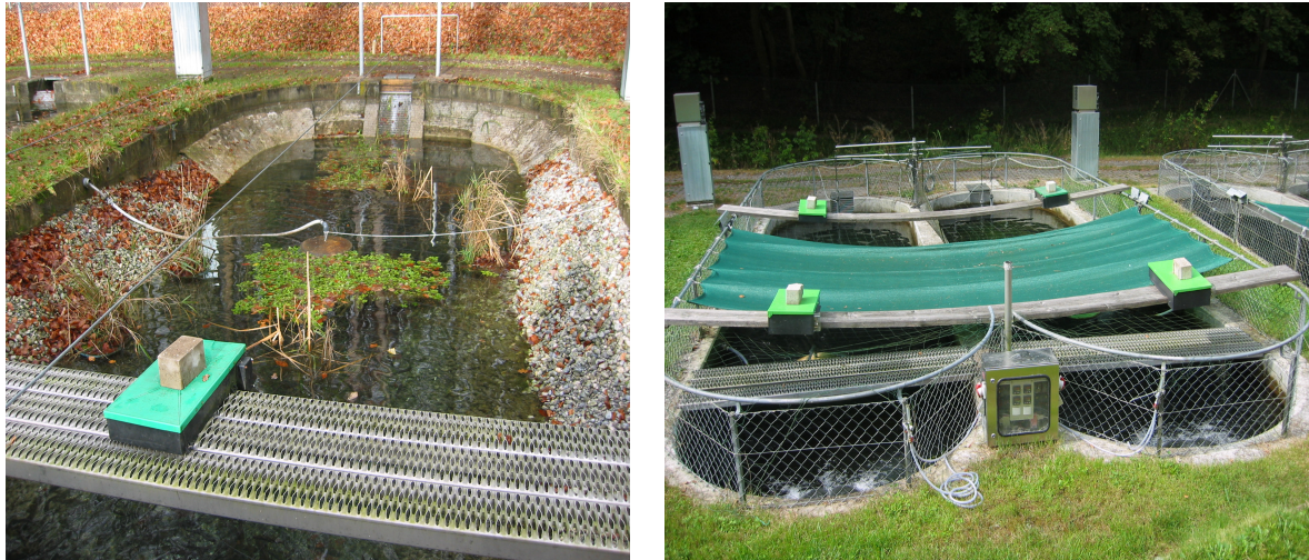
Abb. 2: links: Bioteich, den Vorgaben von Ökoverbänden angepasst; rechts: Konventionelle Betonbecken

Die in den zwei Freilandversuchen eingesetzten extrudierten Biofuttermittel wurden mit durchschnittlichen FQ von 0,93 bzw. 0,96 sehr gut verwertet. Aufgrund der deutlich höheren Futtermittelpreise lagen die Zuwachskosten dennoch um 31 % bzw. 22 % über der konventionellen Produktion. Die Jahresproduktion pro Sekundenliter Frischwasserzulauf war in diesen Fällen um 28 % bzw. 41 % reduziert. Um einen vergleichbaren Ertrag pro kg Fisch (Marktleistung in €/kg) zu erzielen, müsste bei der Produktion von Bioforellen ein Biozuschlag von 9 % erzielt werden. Für eine vergleichbare Arbeitsentlohnung (in € pro Arbeitskraftstunde AKh) müsste der Preiszuschlag für Bioforellen bereits 19 % betragen. Soll der Faktor Zulaufwasser (in € pro Sekundenliter l/s) gleichen Ertrag abwerfen, um mit der konventionellen Produktion vergleichbar zu sein, müsste ein Biozuschlag von 50 % erzielt werden.