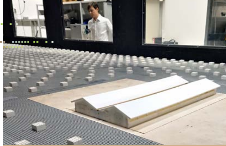
Hightech-Optimierung: Gruber Stallmodell aus dem 3D-Drucker in Windkanalversuchen der TU München