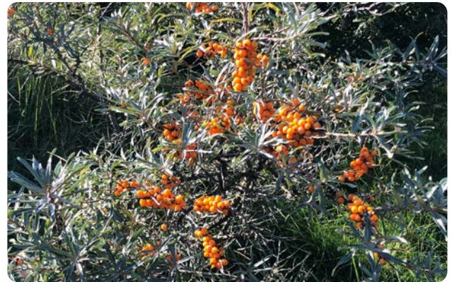
Sanddorn-Kleinstrauch mit vielen orangefarbenen Beeren

Der Sanddorn wird selten höher als 3 m. Er wächst in Norddeutschland an den Küstendünen, in Bayern auf den Flussschottern der alpinen Flüsse. Die unscheinbaren Blüten erscheinen im April. Das Gehölz ist zweihäusig. Das bedeutet, dass sich an einer Pflanze entweder nur männliche oder nur weibliche Blüten entwickeln. Die essbaren orangefarbenen Beeren sind reich an Vitamin C.