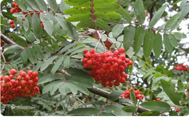
Reife Früchte einer Eberesche

Das Gehölz wird bis zu 120 Jahre alt. Die kleinen, weißen Blüten erscheinen Ende Mai bis Juni und bilden ca. 15 cm breite Trugdolden. Die als Vogelnaehrung wichtigen roten Beeren reifen Ende August.