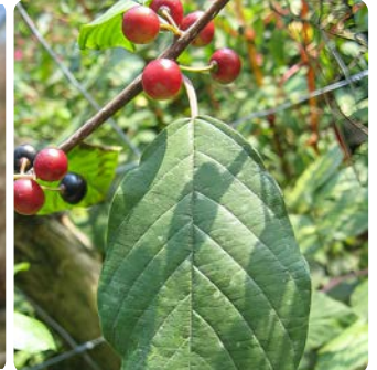
Behaarte Knospen Früchte verschiedener Reife