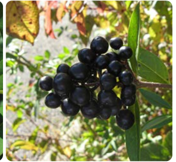
Beeren des Liguster