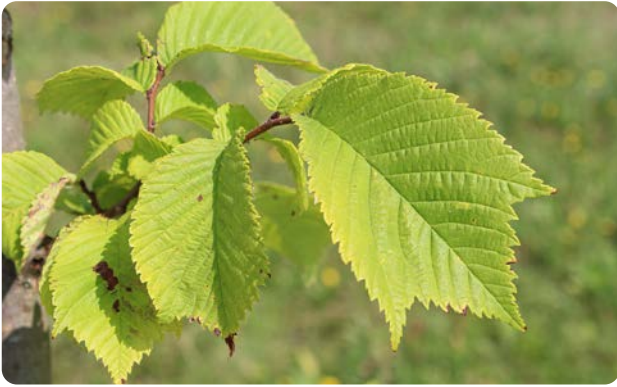
Dreispietziges Blatt der Berg-Ulme