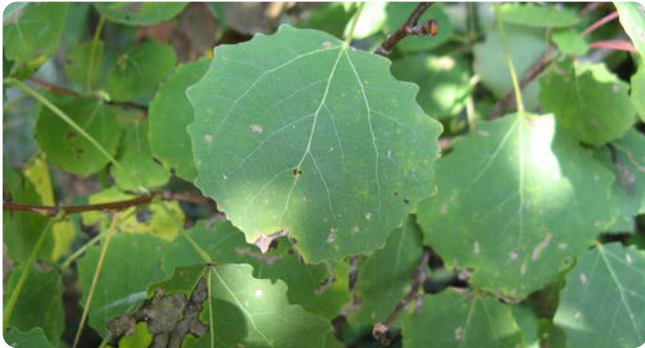
Blatt der Zitter-Pappel

Der schnellwüchsige, bis zu 30 m hohe Baum wächst auf grundwasserfernen Standorten und neigt zu Wurzel ausläuferbildung. Die grauen Blütenkätzchen erscheinen vor den Blättern im März. Der Blattstiel ist vor der Blattspreite seitlich zusammengedrückt und sehr biegsam. So raschelt das Laub im Wind, wovon der Spruch „Zittern wie Espenlaub“ stammt.