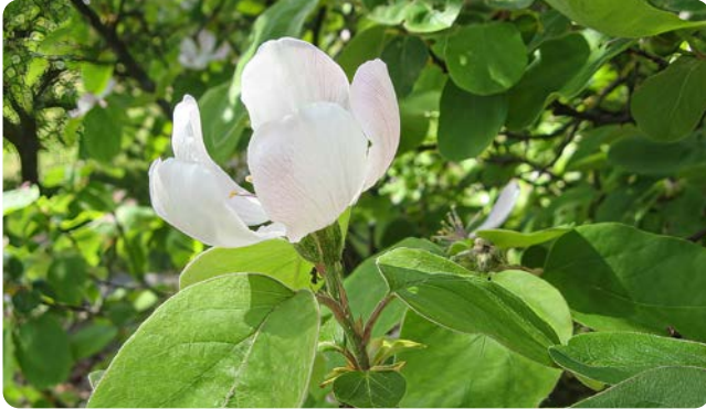
Blüte der Birnenquitte

Die Quitte ist eine Obstart, die nur in Weinbau-gebieten außerhalb der Gärten anzutreffen ist. Sie wurde bereits in der Antike kultiviert und findet optimale Bedingungen im Mittelmeerbereich.