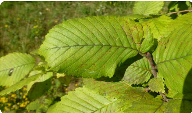
Zahlreiche Blattnerven einer Flatter-Ulme

Der Baum wird bis zu 30 m hoch. Die Flatter-Ulme ist weniger anspruchsvoll als die anderen beiden Ulmen-Arten und kommt vor allem in den großen Flussauen vor. Als einzige europäische Baumart bildet sie im Alter Brettwurzeln aus. Die Blüten erscheinen im April vor dem Laubaustrieb in dicken Büscheln. Ab Mai reifen als Früchte 1 bis 2 cm große, geflügelte Nüsschen heran. Das Blatt ist in der Mitte am breitesten, unterscheidet sich aber durch die zahlreichen (bis 19) Blattnerven und die nach vorn einwärts gekrümmten Blattzähne von dem der Feld-Ulme.