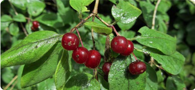
Paarweise am Zweig angeordnete Beeren

Der Strauch ist schattenverträglich und wächst in Wäldern, Gebüsch, Hecken und an Waldrändern. Die gelblichen Blüten erscheinen im Mai. Die roten Beeren reifen im Juli, sind erbsengroß und hängen paarweise am Zweig. Für den Menschen sind die Früchte leicht giftig, für Vögel hingegen nicht.