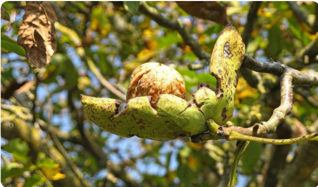
Reife Walnuss am Ast

Die Walnuss erreicht eine Höhe von 25 m und kann 400 Jahre alt werden. Der Baum ist wärmeliebend und anspruchsvoll. Die 15 cm langen männlichen Blütenkätzchen erscheinen an der Basis, die weiblichen Blüten an der Spitze der Neutriebe. Blütezeit ist im Juni, Fruchtreife im September. Die Blätter duften aromatisch und setzen sich aus fünf, sieben oder neun ovalen Fiederblättchen zusammen.