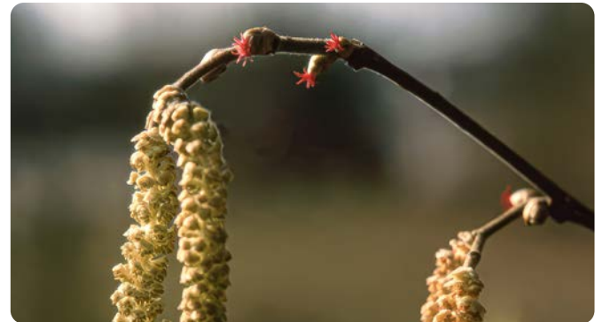
Gelbe männliche und rote weibliche Blütenbüschel

Die Gewöhnliche Hasel ist ein Großstrauch und kommt in lichten Laubmisch- und Auenwäldern, an Waldrändern, in Hecken und Gebüsch vor. Die Blüten öffnen sich im März, die Haselnüsse reifen im September.