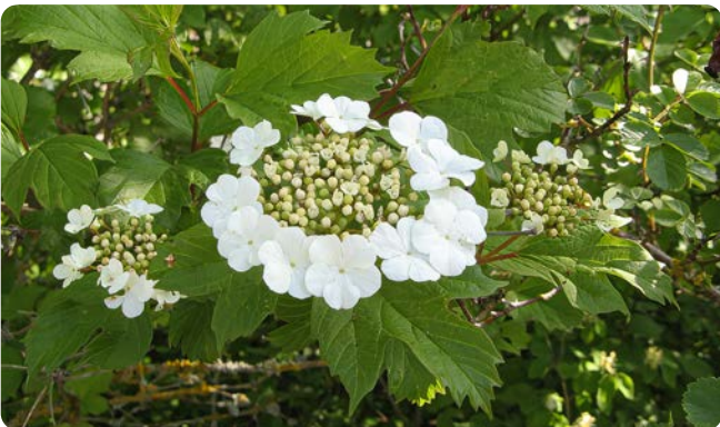
Auffallend weiße Randblüten

Der Strauch besiedelt feuchte Bereiche wie Auen, Bachufer und Bruchwälder. Die Blüten erscheinen von Mai bis Juni. Die roten Früchte hängen oft noch im Februar am Strauch.