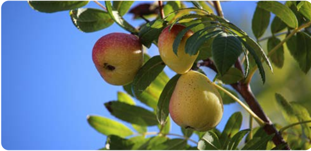
Apfel- oder birnenförmige Früchte des Speierlings

Das natürliche Vorkommen dieses wärmeliebenden Baumes deckt sich mit den Weinbaugebieten. Die weißlichen Blüten öffnen sich im Mai nach dem Laubaustrieb zu einer bis 10 cm breiten, rispenförmigen Trugdolde. Die 2 bis 3 cm großen, apfel- oder birnenförmigen Früchte sind erst überreif oder nach Frosteinwirkung genießbar.