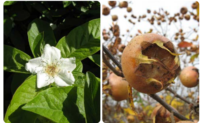
Große weiße Einzelblüten

Der 1 bis 4 m hohe Strauch wurde in der Römerzeit eingeführt und im Mittelalter als Obstgehölz angebaut. Das wärmeliebende Gehölz kommt im Unterholz lichter Wälder, an Waldrändern und in Hecken, vor allem in Weinbaugebieten vor. Ab Ende Mai erscheinen die weißen, großen Blüten. Die apfelförmige Frucht mit den breiten Kelchen und den bleibenden Kelchblättern färbt sich bei Reife braun. Sie wird erst nach Frosteinwirkung genießbar.