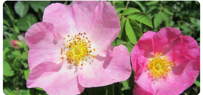
Große rosa Blüten der Essig-Rose

Die Essig-Rose wird bis zu 80 cm hoch und kommt in Eichenwäldern, Gebüschsäumen und Hecken vor. Die Stacheln sind ungleich, teils borstig, teils kräftig, gerade und gekrümmt. Die duftenden Blüten erscheinen sehr spät, sind groß und rosa bis purpurrot gefärbt. Sie besitzt mit 6 cm die größten Blüten der heimischen Wildrosen. Diese Rose ist an der Entstehung unserer Kulturrosen beteiligt. In der Landschaft ist sie selten.