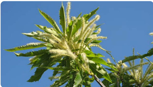
Pollenreiche Blütenkätzchen einer Esskastanie im Juni

Der ca. 30 m große Baum ist in Deutschland noch relativ selten anzutreffen. Er kommt vereinzelt in wärmeren und milden Regionen wie der Rheinebene, an der Mosel und am Main vor, meist in Eichen-Mischwäldern. Das Gehölz wurde vermutlich durch die Römer eingeführt. Der Baum ist nicht mit der in Deutschland häufig vorkommenden Rosskastanie verwandt. Die 20 cm langen weißen Blütenkätzchen erscheinen im Juni für zwei bis drei Wochen. Die in einer langstacheligen, dickschaligen Hülle wachsende Frucht reift im Oktober.