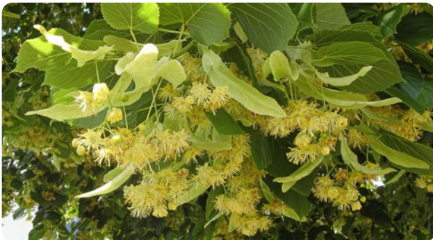
Gelbe, duftende Lindenblüten

Die bis zu 30 m hohe Winter-Linde kann mehrere hundert Jahre alt werden. Der Baum bevorzugt mäßig trockene bis frische, nährstoffreiche Böden und ist anspruchsloser als die Sommer-Linde. Als echter Sommerblüher entwickelt er ab Ende Juni seinen Blütenstand aus gelben Blüten, die an einem Hochblatt sitzen. Die Früchte sind ebenfalls erbsengroß und bräunlich. Von den beiden heimischen Linden hat sie das kleinere, dunklere Blatt. Beide Linden sind bedeutende Bienenweiden.