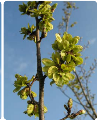
Fruchtstand der Feld-Ulme