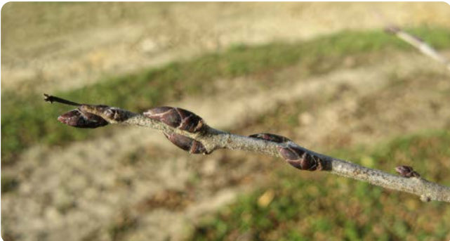
Knospenzweig im Winter

Das Gehölz wächst als Strauch oder kleiner Baum mit Höhen bis zu 8 m. Es bevorzugt kalkhaltige, steinige Standorte und kommt in Hecken, Gebüsch, an Waldrändern und in Auenwäldern vor. Die am Zweig anliegenden Knospen sind länglich zugespitzt und dunkelbraun. Am Rand sind die Knospenschuppen fein bewimpert. Kurztriebe dieses Gehölzes enden oft in Dornen. Die unscheinbare, grüngelbe Blüte erscheint gehäuft in den Blattachseln. Die schwarzen Beeren werden von Vögeln gerne gefressen.