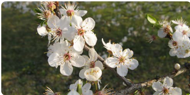
Zahlreiche kleine weiße Blüten einer Felsen-Kirsche

Der bis zu 8 m hohe Strauch wächst auch als kleiner Baum. Das Gehölz hat sein natürliches Verbreitungsgebiet in Südeuropa, die nördliche Verbreitungsgrenze liegt in Bayern im Jura. Es liebt warme, sonnige und kalkhaltige Standorte. Die duftenden Blüten erscheinen im April, die schwarzen Früchte reifen ab Juli.