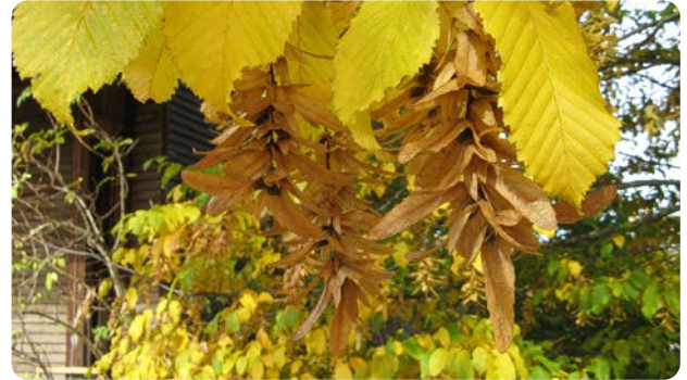
Blätter und Früchte mit leuchtender Herbstfärbung

Die Hainbuche ist ein häufiges Gehölz in Europa. Die Blütenkätzchen erscheinen im April, die Früchte reifen im Oktober in Büscheln als Nüsschen. Die beliebte Heckenpflanze verträgt einen Schnitt gut und behält das Laub im Winter.