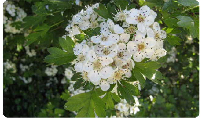
Cremeweiße Blüten des Eingrifflichen Weißdorn

Das Gehölz ist ein dorniger, dicht wachsender Strauch, der bis zu 7 m hoch wird, aber als kleiner Baum bis zu 10 m erreichen kann. Er wird über 100 Jahre alt. Die Blüten erscheinen von Mai bis Juni und werden gerne von Bienen und Schmetterlingen besucht. Seine roten Früchte und die dornige bis an den Boden reichende Verzweigung machen ihn zu einem unentbehrlichen Nist- und Nährgehölz für Vögel. Weißdornarten sind weit verbreitet und bevorzugen kalk- und nährstoffreiche, sonnige Standorte. Sie sind schwer voneinander zu unterscheiden.