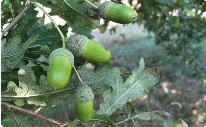
Langgestielte Früchte der Stiel-Eiche

Die Stieleiche ist in ganz Bayern verbreitet. Sie wird 40 m hoch. Ihr Hauptstamm ist meist kurz und verzweigt sich in mehrere Wipfeltriebe. Der Baum wächst in Auen und Laubmischwäldern, ist anspruchslos und robust. Sie blüht gleichzeitig mit dem Laubaustrieb und etwas später als die Trauben-Eiche. Ab September reifen als Früchte die langgestielten Eicheln, von denen der Name Stiel-Eiche stammt. Diese Eicheln sind ein gutes Futter für das Wild und wurden früher auch für die Schweinemast verwendet. Eichenholz ist unter Wasser sehr gut haltbar, so dass es z. B. für den Schiffsbau oder für Wein- und Whiskyfässer verwendet wird.