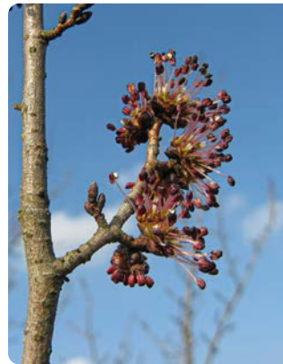
Blütenstand der Feld-Ulme

Der Baum wird bis zu 30 m hoch. Das wärmeliebende Gehölz bevorzugt sonnige bis halbschattige, nährstoffreiche und kalkhaltige Standorte. Es wächst in Deutschland entlang der Stromtäler von Rhein, Donau, Elbe und Isar meist in der Hartholzau. Die Blüten erscheinen vor Laubaustrieb ab Mitte März. Ab April reifen als Früchte 1 bis 2 cm große, geflügelte Nüsschen. Die Blätter können bis zu 15 cm lang werden. An den Zweigen bilden sich oft Korkleisten.