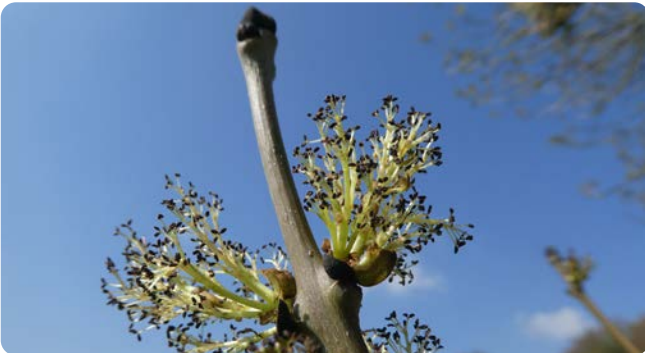
Typische schwarze Knospen mit Blütenaustrieb

Die Gemeine Esche ist ein bis zu 40 m hoher Baum der Auen und Schluchtwälder. Die unscheinbare Blüte erscheint vor dem Laubaustrieb im Mai. Die geflügelten Samen werden durch den Wind verbreitet.