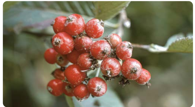
Filzig behaarte Früchte

Die Mehlbeere wächst als kleiner bis zu 12 m hoher Baum oder Großstrauch, der bis 200 Jahre alt werden kann. Sie bevorzugt steinige, felsige Standorte und kommt in den Alpen bis auf Höhen von ca. 1.500 m vor. Die weißen Blüten erscheinen Ende Mai bis Juni. Die roten Früchte reifen im September. Sie sind an der Spitze filzig behaart. Die dunkelgrünen, ovalen, gesägten Blätter sind auf der Unterseite weißfilzig. Das Gehölz ist eine gute Bienenweide und ein wichtiges Vogelnährgehölz.