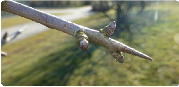
Dornen am Kurztrieb einer Wild-Birne