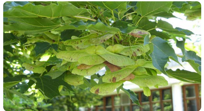
Stumpfwinklig geflügelte Nüsschen

Der Baum wird bis zu 30 m hoch und bis zu 150 Jahre alt. Seine Krone ist im Freiland breit gerundet. Der anspruchslose Spitz-Ahorn wächst in Laubmisch- und Auwäldern. Die Blüten erscheinen Anfang April in gelbgrünen Doldentrauben vor dem Laub und sind eine wichtige Bienenweide. Im September entwickeln sich die Früchte mit den stumpfwinkligen Flügeln.