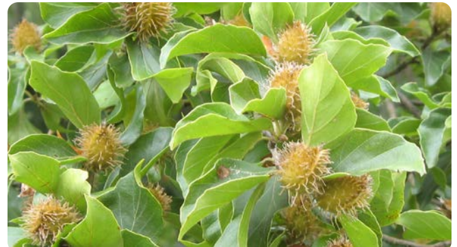
Weichstachelige Fruchtbächer einer Gewöhnlichen Buche

Der Baum wird bis zu 40 m hoch und kann 300 Jahre alt werden. Unsere häufigste Laubbaumart in Wäldern bevorzugt frische, nährstoffreiche und lehmige Böden. Sie meidet Sand- und Moorböden und ist in den Alpen bis 1.500 m zu finden. Erst ab einem Alter von 30 Jahren beginnt das Gehölz zu blühen und zu fruchten. Die Blüten erscheinen mit den Blättern Ende April. Die weichstacheligen Fruchtbächer verholzen langsam und ab September entwickeln sich in ihnen als Früchte die ca. 2 cm langen Bucheckern. Diese sind glänzend rotbraun und scharf dreieckig. Die Bucheckern wurden wie auch die Eicheln früher zur Schweinemast genutzt. Alle vier bis acht Jahre, in sogenannten Mastjahren, fruchtet die Buche reichlich.