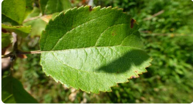
Rundliches Blatt mit dunkelgrüner Oberseite

Die wechselständigen Blätter sind 4 bis 8 cm groß, breitelliptisch bis kreisrund und ihre Oberseite ist stumpfdunkelgrün. Die Herbstfärbung ist unbedeutend grau-grün oder fahlgelb. Das Gehölz ist eine wichtige Nahrungsquelle für Insekten und zahlreiche weitere Tierarten.