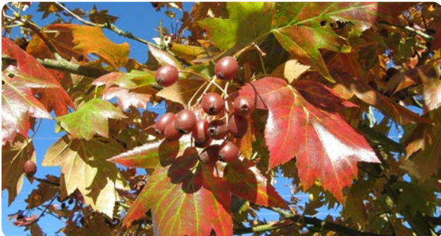
Fruchtweig der Elsbeere im Herbst

Der bis zu 20 m hohe Baum wächst nur langsam. Er kommt überwiegend auf trockenen, steinigen Kalkböden vor. Die Blütenstände öffnen sich Ende Mai bis Juni. Die bräunlich gefärbten Früchte reifen im Herbst, während sich die ahornähnlichen Blätter rot färben.