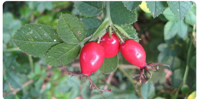
Leuchtend rote Hagebutten

Der kleine Strauch besiedelt häufig Waldränder, Hecken und Gebüsch auf vorzugsweise kalkhaltigen, steinigen bis lehmigen Böden. Die Blüten sind rosa, die Hagebutten scharlachrot. Die drüsigen Fiederblättchen verströmen einen starken Apfelgeruch.