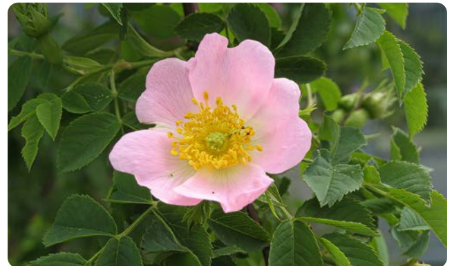
Zartrosa Blüte der Hunds-Rose

Unsere knapp 30 Wildrosenarten sind an Waldsäumen, in Hecken und Gebüsch anzutreffen. Die Standortansprüche sind sehr unterschiedlich, eine Gemeinsamkeit sind die Stacheln. Die bekannteste Art ist die Hunds-Rose mit ihren weiß bis rosa gefärbten Blüten. Diese erscheinen im Juni. Im Spätsommer färben sich die Hagebutten rot. Der Strauch ist ein wichtiges Vogelschutz- und Nährgehölz.