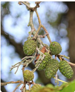
Unreife, eiförmige Zapfen

Die Schwarz-Erle ist ein bis über 25 m hoher Baum mit schlank aufgebauter Krone. Sie kann etwa 120 Jahre alt werden. Die Rinde ist rissig und sehr dunkel und das Holz färbt sich nach dem Anschnitt leuchtend rot. Der Baum verträgt von allen Gehölzen die meiste Bodenfeuchtigkeit und kommt daher in Sümpfen und an Gewässern vor. Ihre Blütenkätzchen erscheinen im März. Die Fruchzapfen bleiben über den Winter am Zweig. Die Blätter sind an der Spitze meist eingebuchtet.