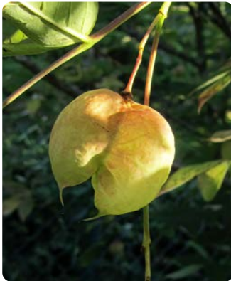
Aufgeblasene Kapsel Frucht