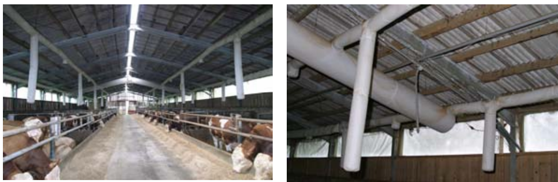
Abb. 2: System für kontinuierliche homogene Tracergasverteilung. links: Gesamtansicht. rechts: Ausschnitt mit Hauptverteiler, Nebenverteiler und zwei senkrechten Auslässen

Für die simultane Schadgasmessung wurde ein Multigasanalysator Modell Innova 1312 (Firma Innova) und eine Messstellenumschaltung (eigene Entwicklung) eingesetzt. Die Probenahme der Stallluft erfolgte kontinuierlich an den neun Messorten für Kohlenmonoxid und wurde über eine beheizbare Messgasleitung in den Messcontainer geführt. Pro Messstelle wurden die Konzentrationen von Ammoniak, Lachgas, Kohlenmonoxid, Kohlendioxid, Methan und Wasserdampf bestimmt. Ein Messzyklus dauerte drei Minuten pro Messort. Dies ergibt sich aus den für die Einzelmessung notwendigen Integrationszeiten und Spülvorgängen der Messzelle. Zur Steuerung und Datenerfassung wurden eigens entwickelte Software und das kommerzielle Softwarepaket Labtech-Notebook pro verwendet. Diese Tracergas-Messungen wurden jeweils über die Dauer von fünf Tagen an einem Mastbullenstall sowie an zwei Milchviehställen durchgeführt. Die kontinuierliche Gasmessung und die Erfassung der Meteorologie am Standort lief über mehrere Wochen.