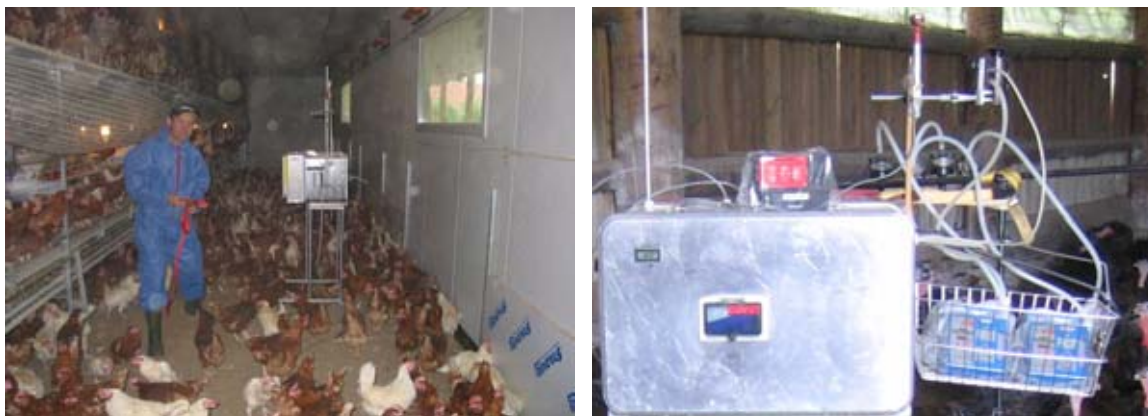
Abb. 1: Messbox zur kontinuierlichen Erfassung der Staubmasse, Partikelkonzentration und Ammoniakkonzentration. Links: Messung in einem Geflügelstall. Rechts: Messung in einem Mastputenstall, mit Geräten zur Messung am Arbeitsplatz