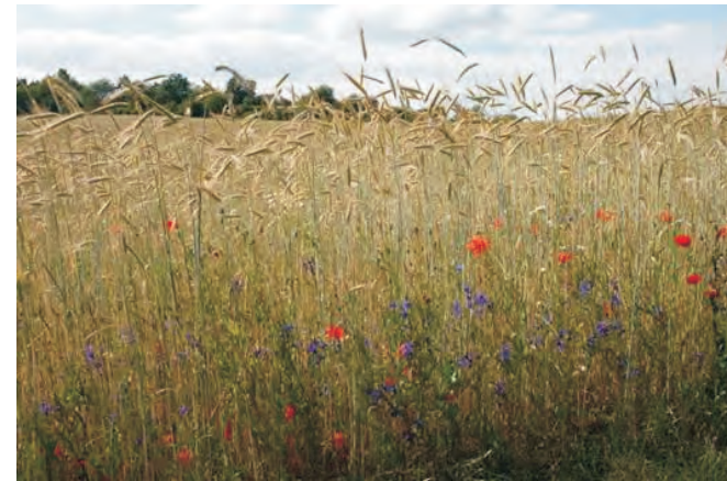
Artenreicher Öko-Roggen (Wettbewerb 2014, Unterfranken)

Ob Kalkscherben-, Lehm- oder Sandäcker - gerade die Oberpfalz mit ihren abwechslungsreichen Landschaften und vielfältigen Standorten beherbergt ein großes Potential an wertvollen Ackerlebensräumen. Besonders auf weniger ertragreichen Böden wird zum Teil bereits Ackerwildkrautschutz in Form von VNP oder KULAP betrieben. Deshalb erhoffen wir uns rege Beteiligung – aber auch so manche Überraschung!