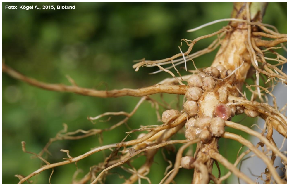
Abb. 3 Knöllchen zur Bindung von Luftstickstoff an der Wurzel der Sojapflanze

Etwas öfter als im Jahr 2014 war eine gleichmäßige Verteilung der Knöllchen über das gesamte Wurzelwerk der Sojabohne gegeben, wobei dieser Zustand nach der Verwendung von Rhizoliq Top S immer beobachtet wurde.