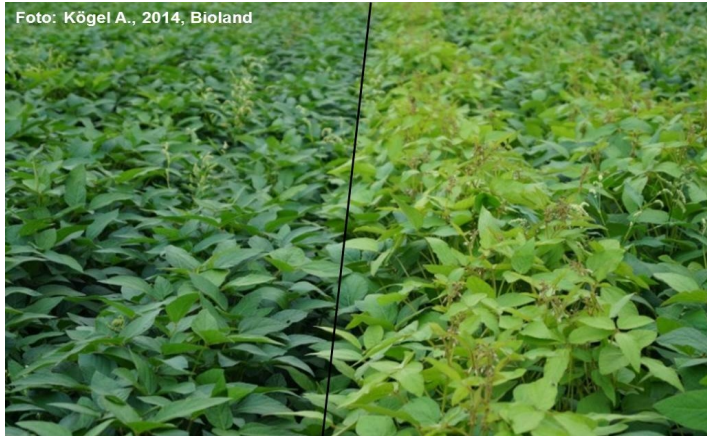
Abb. 4 geimpfter (links) bzw. ungeimpfter Sojabestand (rechts)

Anhand von Abb. 4 ist auf der linken Bildhälfte eine dunkelgrüne Blattfärbung zu erkennen. Diese deutet auf aktive Knöllchen und damit auf eine gute Stickstoffversorgung der Pflanzen hin. Im Gegensatz dazu zeigt der Bestand auf der rechten Seite des Fotos deutliche Blattaufhellungen. In diesem Fall blieb die Impfung des Saatgutes aus, sodass sich keine Knöllchen an den Wurzeln der Sojapflanzen entwickeln konnten. Eine angemessene Stickstoffversorgung war hier nicht gegeben