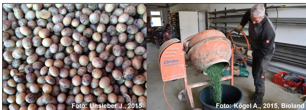
Abb. 1 Vorgehen bei der Sojaimpfung: Impfmittel in Kombination mit Wasser (Bild links), Impfung mit Haftmittel per Zwangsmischung (Bild rechts)

Bei der Trockenimpfung findet eine einfache Durchmischung des Impfmittels auf Torfbasis mit der Sojabohne statt. Das Präparat verbindet sich mit den Körnern und kann anschließend ausgesät werden Abb. 1 (Bild links). In einigen Fällen wird das Impfmittel zusätzlich mit Wasser angerührt. Dieser Vorgang bewirkt eine höhere Haftung der Bakterien an der Sojabohne. Dabei darf jedoch lediglich Regen- oder Grundwasser verwendet werden, um eine Schädigung der Bakterien, beispielsweise durch Chlor, zu vermeiden.