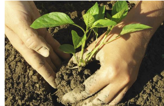
Erhaltung & Mehrung fruchtbaren Bodens