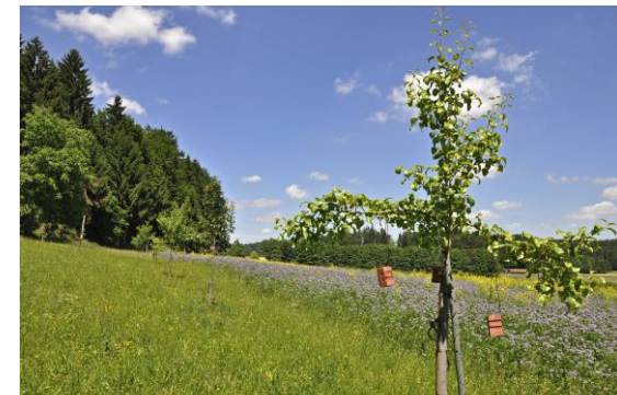
Positive Entwicklung im ländlichen Raum