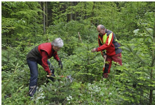
Erholungsfunktion der Kultur-Landschaft