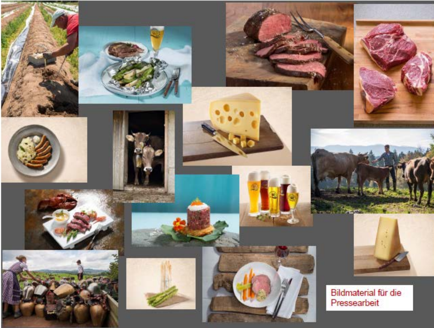
Bildmaterial für die Pressearbeit