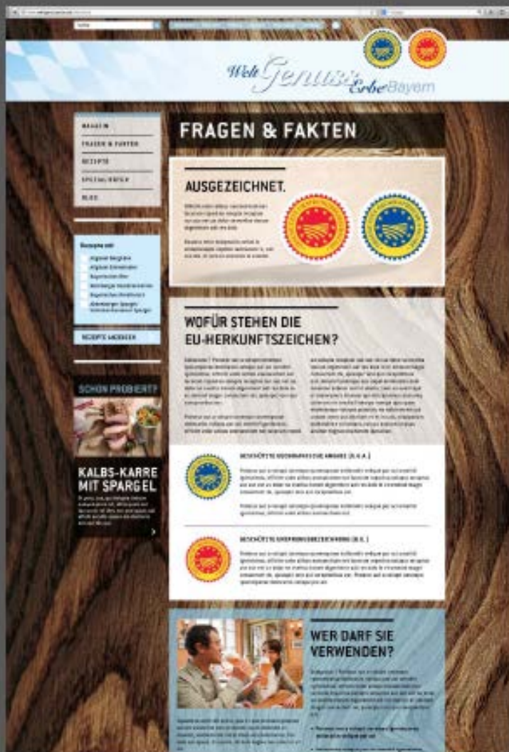
Beispielhaft: Erklärung zu den Zeichen