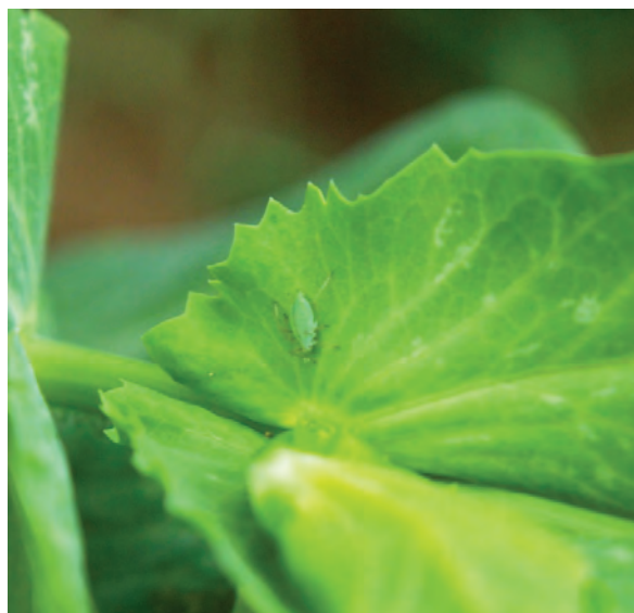
Abb. 1: Erbsenblattlaus

Bekämpfung: Ab einer Befallsdichte von 15 Läusen je Haupttrieb ist ein Insektizideinsatz sinnvoll.