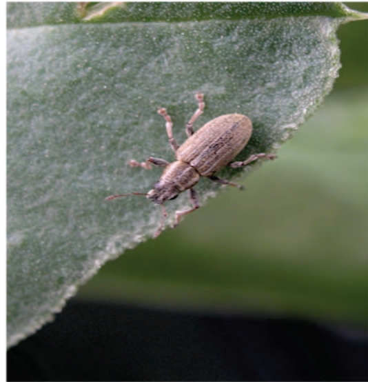
Abb. 3: Adultes Tier des Blattrandkäfers

Bekämpfung: Durch die Vielzahl der Wirtspflanzen ist die Bekämpfung eher schwierig. Für eine Stärkung der Pflanze durch angepasste Düngung sorgen. Anbaupausen von mindestens 5 Jahren einhalten und die Distanz der Leguminosenschläge maximieren.