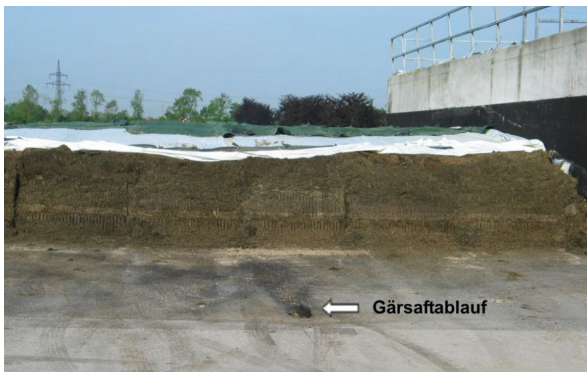
Abb. 4: Grassilage im Anschnitt mit Gärssaftablauf

Bei größeren Siloanlagen ist die Entwässerung in Teilflächen zu prüfen, um nicht verunreinigtes von verunreinigtem Niederschlagswasser zu trennen.