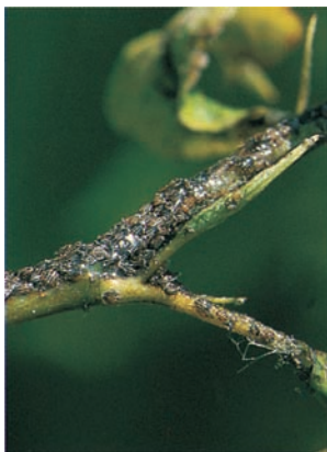
Larven des Birnblattsaugers