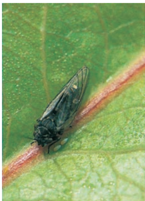
Birnblattsauger bei Eiablage