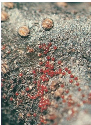
Wintereier der Roten Spinne