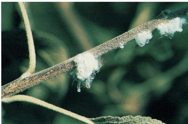
Blutlausbefall an einjährigem Trieb