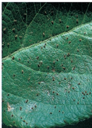
Blatt mit Obstbaumspinnmilben