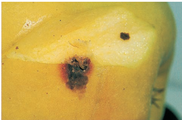
Apfelwicklerraupe mit Schadstelle