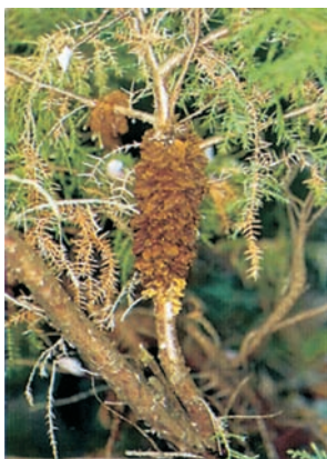
Sporenschleim an Wacholder