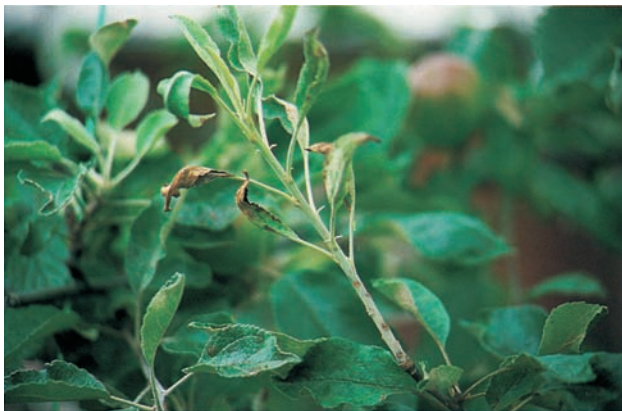
Mehltau an Triebspitze