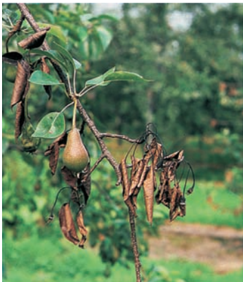
Feuerbrand an Birne