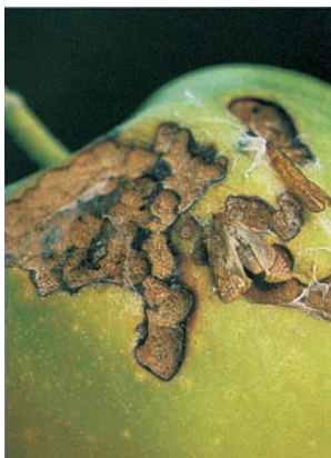
Schadbild mit Jungfalter