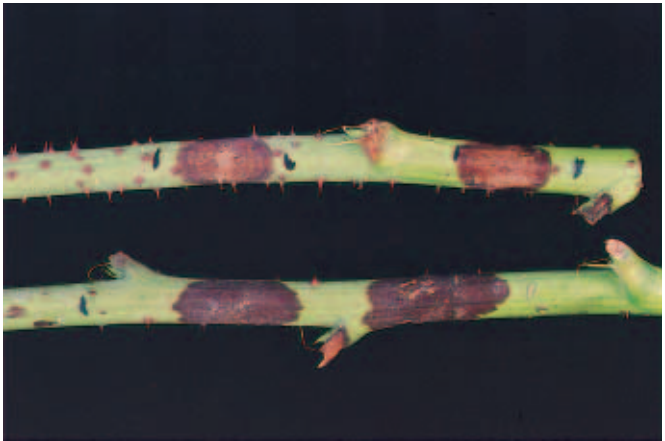
Leptosphaeria unten, Didymella oben