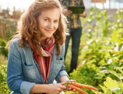
Regionale Erzeugerinnen und Erzeuger