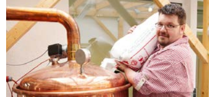
Regionale Verarbeiterinnen und Verarbeiter