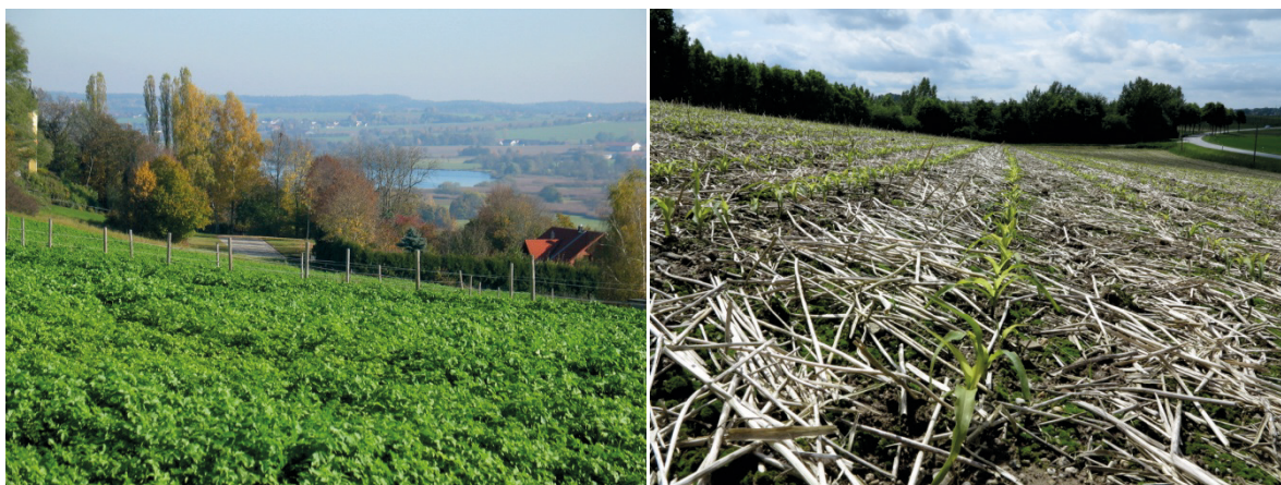
Abb. 1: Senfzwischenfrucht im Herbst, im Hintergrund der Vilstalsee