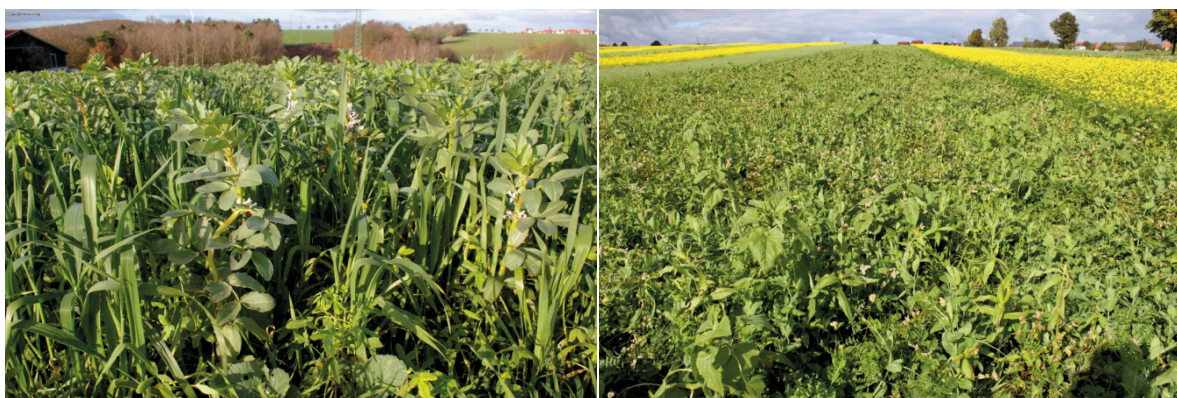
Abb. 6: Mischsaat mit Ackerbohnen