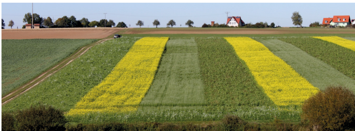
Abb. 5: Schauanlage zur Präsentation von verschiedenen Zwischenfruchtsaaten

Soweit organische Dünger auf dem Betrieb vorhanden sind, können diese durch die Zwischenfrüchte effizient verwertet werden. Es dürfen entsprechend der Düngeverordnung bis zu 30 kg Ammonium- bzw. 60 kg Gesamtstickstoff bis Ende September gedüngt werden, wenn die Saat bis 15. September erfolgt. Die organische Düngung sollte vor der Saat eingearbeitet oder bis spätestens 14 Tage nach der Saat gegeben werden. Die Zwischenfrucht muss mindestens 6 Wochen stehen. Zwischenfrüchte mit einem Leguminosenanteil > 75\% haben keinen Düngebedarf und dürfen deshalb nicht gedüngt werden. Bei hohen N_{min} -Restmengen der Hauptfrucht (z. B. nach Wetterextrema) ist der Verzicht oder eine Reduzierung der Düngung sinnvoll. In Betrieben ohne organische Düngung sollte eine mineralische Düngung (ca. 30-40 kg N/ha) nur dann erfolgen, wenn eine gute Bestandsentwicklung für den Erosionsschutz notwendig ist. Eine Anrechnung der Düngung ist bei der N-Bedarfsermittlung (DSN) im Frühjahr zur folgenden Hauptkultur vorzunehmen. Werden die Zwischenfrüchte als Ökologische Vorrangflächen (Greening) angebaut, ist eine mineralische N-Düngung nicht zulässig.