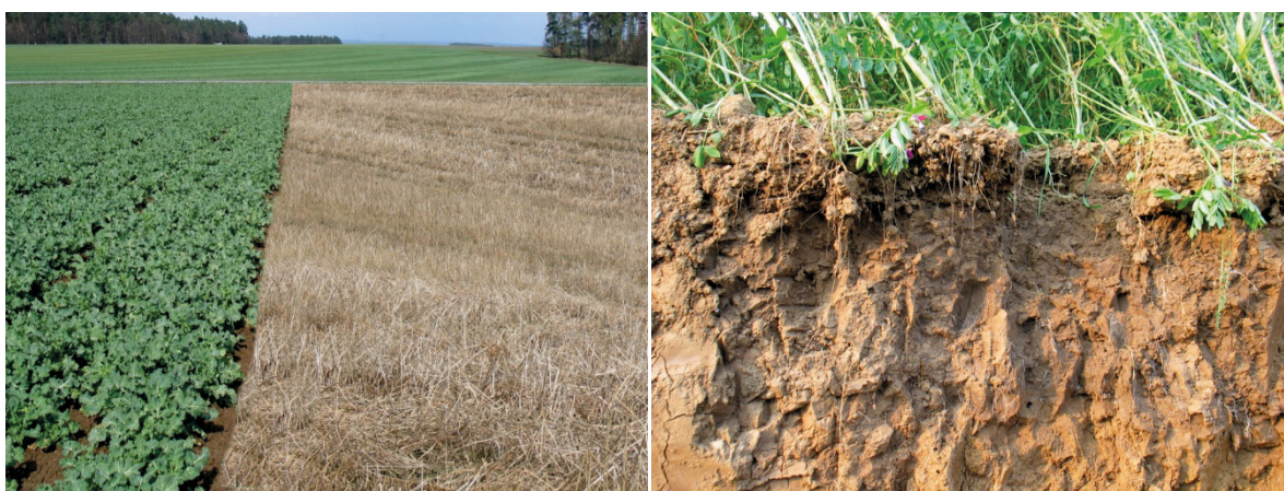
Abb. 3: Winterrüben und abgefrorener Senf im Frühjahr (Bildmontage)

Die Intensität von Bodenbearbeitung und Bestellung richtet sich nach den Ansprüchen der Zwischenfrucht, aber auch der folgenden Hauptkultur. Eine optimale Saatbettbereitung zur Zwischenfruchtbestellung ist erforderlich, wenn die Zwischenfrüchte selbst (kleinsäimiges Saatgut wie Phacelia oder Klee) oder die im Frühjahr folgende Hauptkultur (insbes. Zuckerrüben) hohe Ansprüche an das Saatbett stellen.