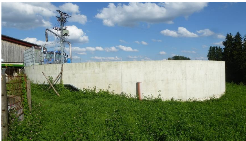
Abbildung 1: Wirtschaftsdünger im Blick:

Um eine gezielte Düngung zu gewährleisten, ist es notwendig, die Nährstoffgehalte eigen produzierter Wirtschaftsdünger zu kennen. Des Weiteren sind ausreichend Lagerkapazitäten für Wirtschaftsdünger vorzuhalten, um den Dünger bedarfsgerecht für die Pflanzen ausbringen zu können.