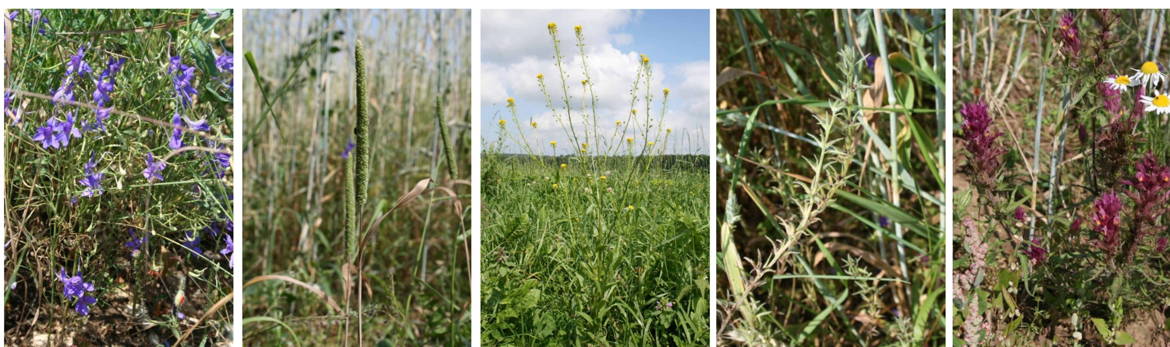
Abb. 2: auf den Fotos von links nach rechts: Consolida regalis (Acker-Rittersporn), Phleum paniculatum (Rispen-Lieschgras), Neslia paniculata (Finkensame), Buglossoides arvensis (Acker-Steinsame), Melampyrum arvense (Acker-Wachtelweizen)

Das Klee gras im zweiten Jahr hatte die neu etablierten Arten wieder stark zurückgedrängt. Allerdings ist das Rispen-Lieschgras neu dazugekommen. Die 4 etablierten Arten werden inzwischen durch die Bewirtschaftung sichtbar verdriftet. Weinbergslauch, Gezähntes Rapünzchen und Finkensame tauchten praktisch nicht auf.