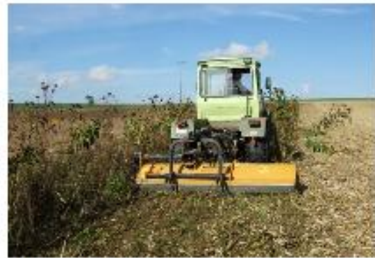
Oktober: Mulchen der letzten Blüte