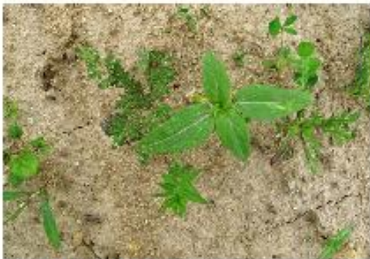
Juni: 4 Wochen nach der Saat