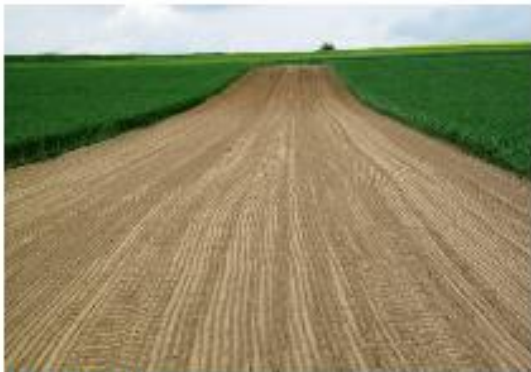
15. Mai: Aussaat