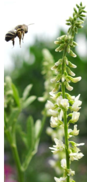
Wildbiene fliegt Steinklee an