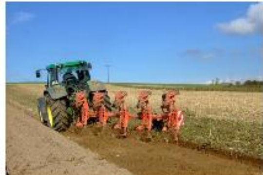
Oktober: Unterpflügen der Pflanzenreste