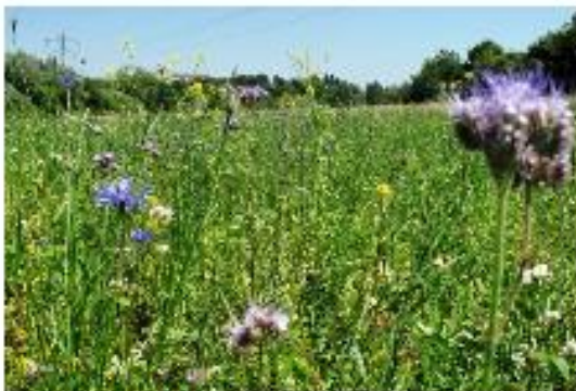
Juli: Es wird bunt...