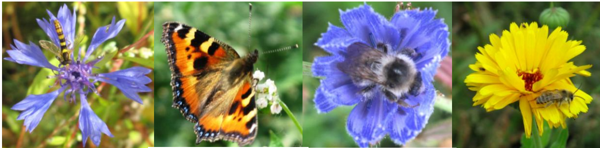
Schwebfliege auf Kornblume

Mit Blühstreifen kann zum Einen Akzeptanzproblemen von Bioenergie und Landwirtschaft entgegen gewirkt werden, zum Anderen konnte durch Versuche der Bayerischen Landesanstalt für Landwirtschaft eine Steigerung der Biodiversität nachgewiesen werden. Mit der Intensivierung der Landwirtschaft wird auch das Nahrungsangebot für Blüten besuchende Insekten immer knapper, vor allem ab Juni, wenn die Rapsblüte vorbei ist. Blühstreifen tragen im erheblichen Maße dazu bei, das Überleben von Blütenbestäubern zu sichern.