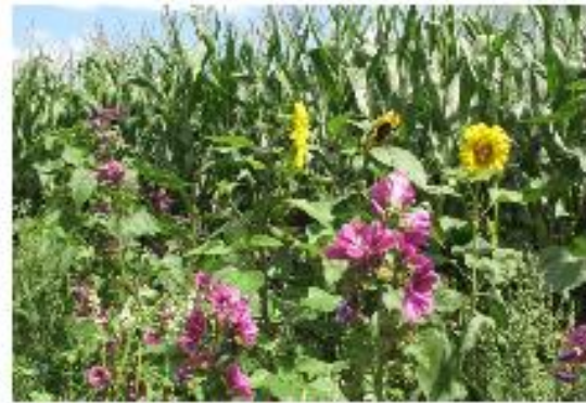
September: Blühstreifen im Mais