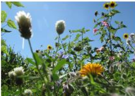
August: ...und ist belebt