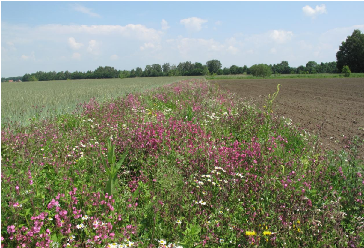
Mehrfähriger Blühstreifen am 12.06.2013, bei Manching

Unsere Kulturlandschaft wird maßgeblich durch die Landwirtschaft geprägt. Die in vielen Jahrtausenden entstandene mannigfaltige Kulturlandschaft ist in den letzten Jahrzehnten vielerorts zurückgegangen. Blühende Wiesen und Wildkrautreiche Äcker sind selten geworden. Bunte blühende Blühstreifen „bestechen“ die Bevölkerung und lassen so manche Beanstandung über die Landwirtschaft im Wandel der Zeit verblassen. Negative Eindrücke (evtl. Geruchs- und Lärmbelästigungen oder optische Einschränkungen) treten so in der Wahrnehmung zurück. Der Blühstreifen bietet sich auch als „Kommunikationsbrücke“ zwischen Landwirt und Bevölkerung an.