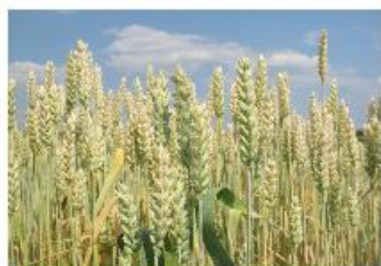
Folgejahr im Juli: Weizen