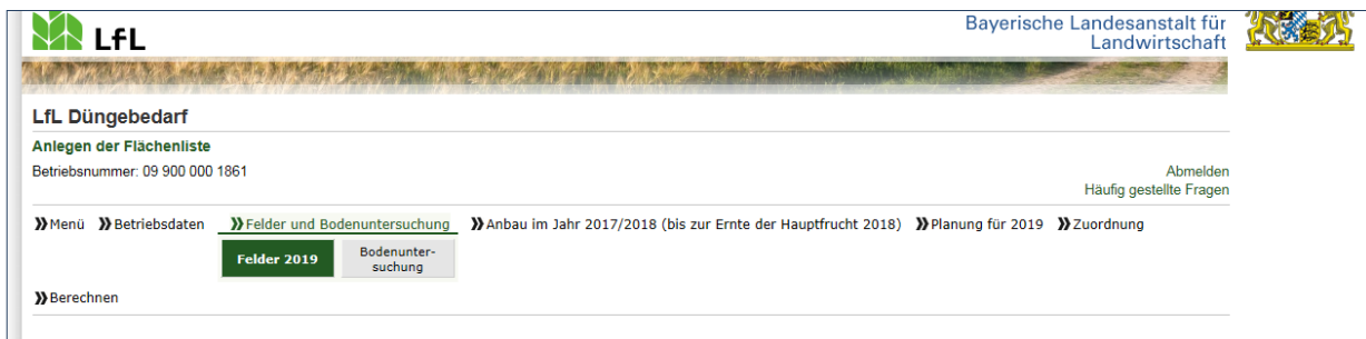
Abbildung 2: Bearbeitungsfeld Flächen des Vorjahres

Unter dem Reiter „Felder und Bodenuntersuchung“ (Abbildung 2) werden alle Flächen des Mehrfachantrages 2018 angezeigt, auf dieser Seite können auch Flächen gelöscht oder neu gepachtete Flächen eingegeben werden. Dazu ist die aktuelle FID-Nummer notwendig, und es müssen die GPS Daten eruiert werden (geht automatisch), um die richtigen Angaben für die Simulation zu erhalten. Die Bodenuntersuchungsergebnisse werden automatisch eingespielt, wenn die Freigabe durch den Landwirt erfolgt ist und bei der Bodenuntersuchung die FID Nummern der Schläge angegeben sind. In den anderen Fällen müssen sie von Hand eingegeben werden. Für Flächen unter 1 ha sind entweder alle oder keine Angaben zu machen.