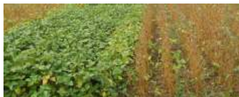
Eine zeitige Abreife ist abhängig vom Saattermin und Sortenwahl.