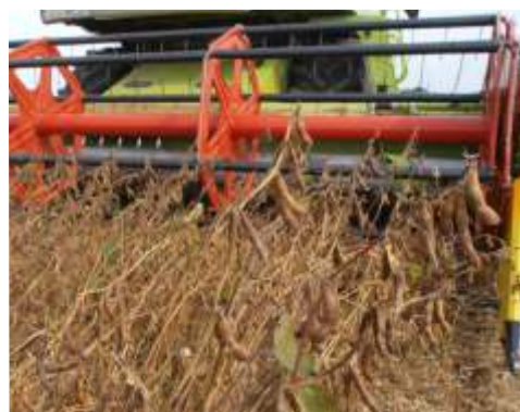
Beim Drusch muss das Schneidwerk ganz abgelassen werden.

Ideal sind leicht erwärmbare Böden mit guter Struktur, um die Jugendentwicklung zu fördern. Kaltluftlagen und Spätfrostlagen sind zu meiden, da Sojabohnen bei Temperaturen unter 8°C mit einem Abwurf der Blüten reagieren. Zur Blüte und zur Kornbildung sind ausreichende Sommerniederschläge oder eine Beregnung nötig. Steinige Böden sind ebenfalls zu meiden, da aufgrund des tiefen Hülsenansatzes das Mähwerk vollkommen abgelassen werden muss und dadurch Probleme bei der Ernte entstehen. Aus diesem Grund sollte bei der Bestellung auf einen optimal eingeebneten Boden geachtet werden.