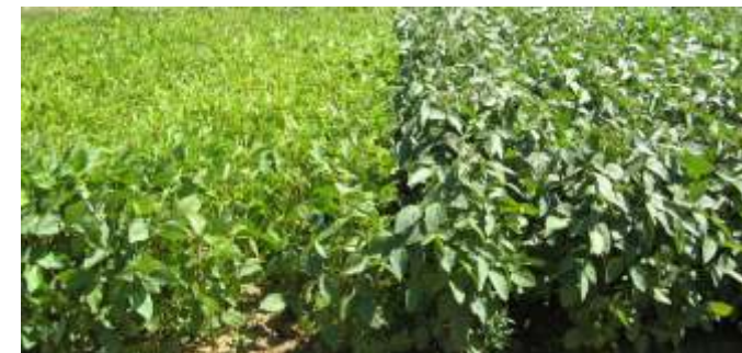
Erfolgreiches Impfen ist eine der wichtigsten Maßnahmen beim Anbau von Soja; oben Wurzeln mit Knöllchen; unten links ungeimpfte, rechts geimpfte Sojabohnen