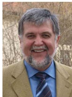
Jakob Opperer Präsident der LfL

15:30 – 15:45 Seminarabschluss und Verabschiedung