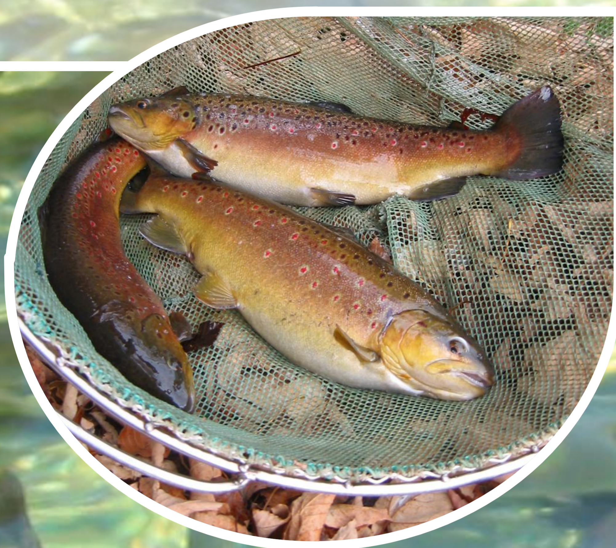
Auswahl geeigneter Laichfische

Der weibliche Fisch (Rogner) wird mit der Hand vorsichtig von vorn nach hinten abgestreift, so dass die Fischeier (Rogen) aus der Geschlechtsöffnung austreten.