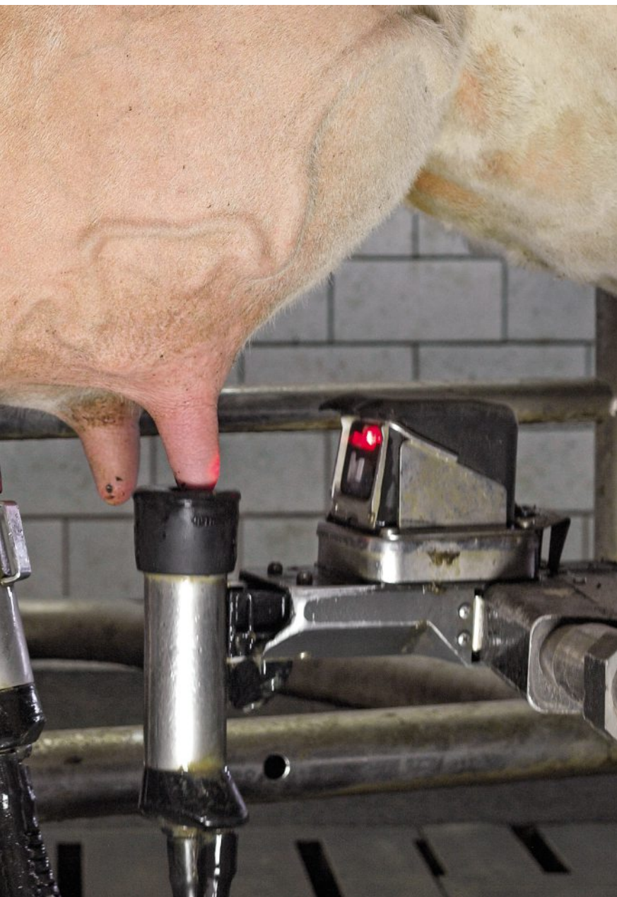
Foto: LfL/LfL. Es handelt sich nicht um das bei der Befragung vorgelegte Bild.

»Die arme Kuh!« Manchmal äußern Verbraucher Vorbehalte gegenüber der Technik, auf die man als Landwirt überhaupt nicht kommen würde.