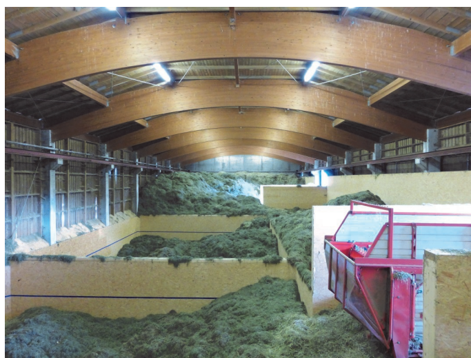
Praxisbetrieb mit vier Belüftungsboxen für 10.000 m 3 Belüftungsheu und Ladewagen mit Dosierwalzen zur Futtervorlage