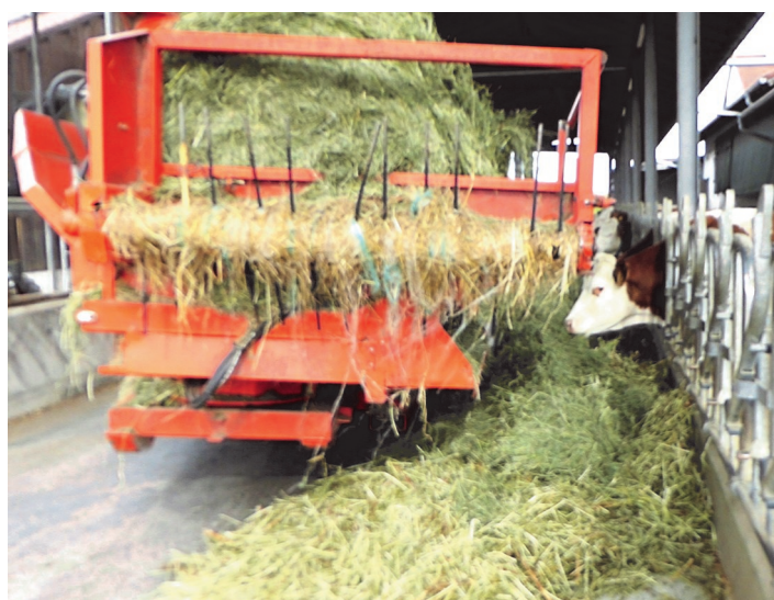
Futtermontage von Belüftungsheu mit Rundballen-Auflöser direkt auf den Futtertisch