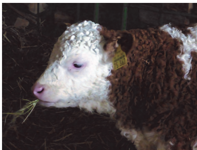
Grobfutter-Aufnahme muss gelernt werden - schon das fünf Tage alte Kalb versucht sich am Belüftungsheu