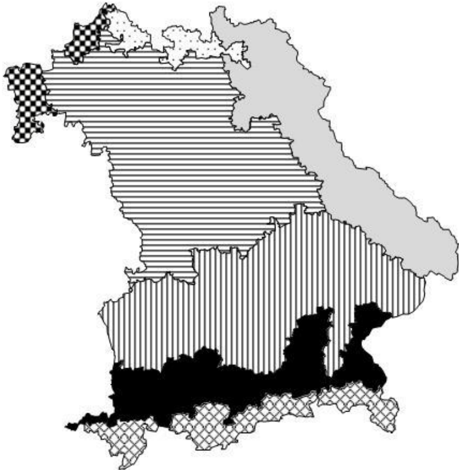
Karte der Anbauggebiete