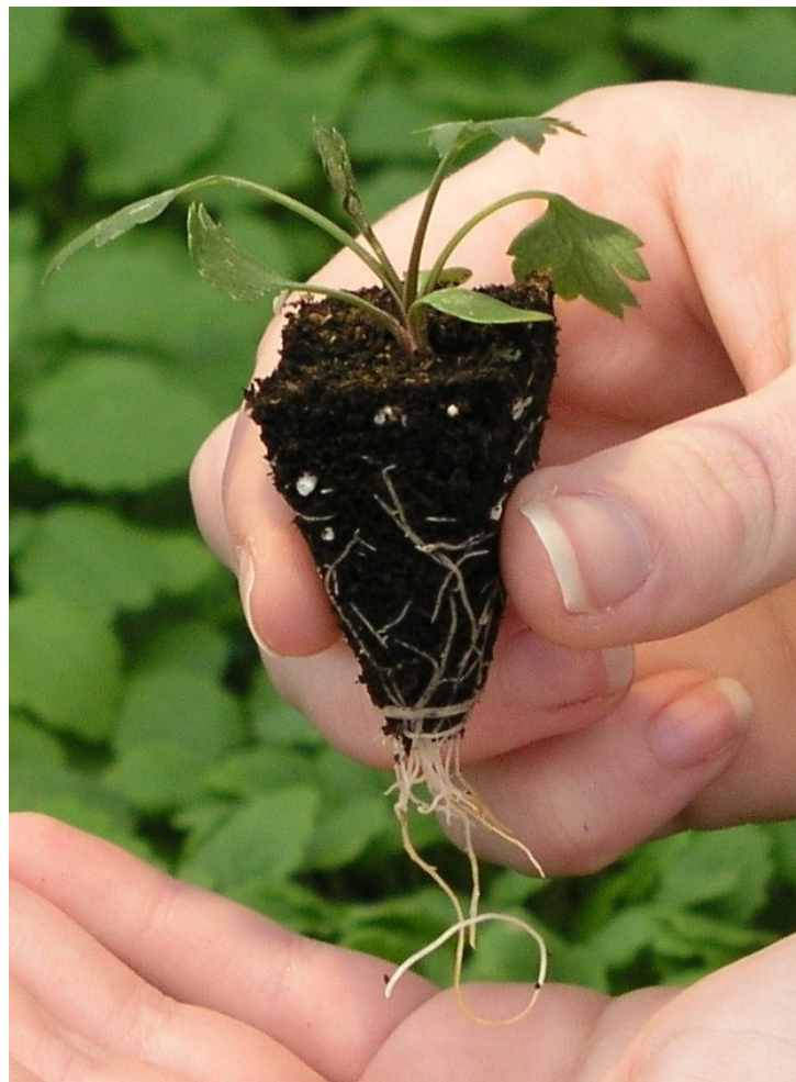
Abb. 4: Pflanzfertige Jungpflanze