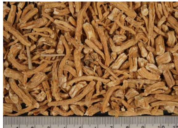
Abb. 11: Wurzeldroge aus bayerischem Feldanbau