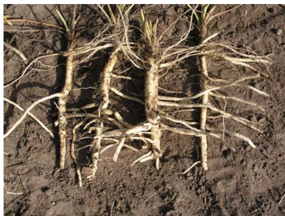
Abb. 9: Einjährige Wurzeln aus Drillsaat

Die Erträge schwankten in den Versuchen zum einjährigen Anbau für die Pflanzkultur zwischen 80 und 120 Dezitonnen frischer Wurzeln pro Hektar, für die Drillsaat zwischen 90 und 100 Dezitonnen. Bei einem Eintrocknungsverhältnis (EV) zwischen Frischware und Droge von 3,0 bis 3,9 sind das etwa 23 bis 35 beziehungsweise 29 bis 33 Dezitonnen Wurzeldroge pro Hektar. Das Gewicht eines frischen Wurzelstockes kann zwischen 90 und 170 Gramm bei der Pflanzung sowie zwischen 35 und 40 Gramm bei der Drillsaat betragen. Die Angaben zur Drillsaat beziehen sich bisher aber nur auf einen ersten Exaktversuch im Jahr 2008 mit der empfohlenen Herkunft 'BLBP 03'.