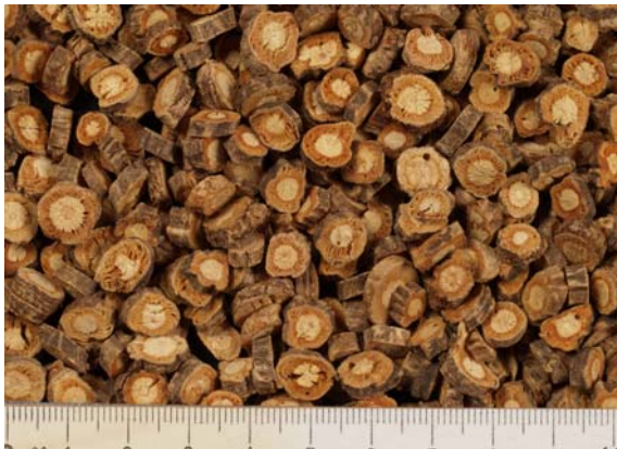
Abb. 10: Traditioneller Scheibenschnitt bei chinesischer Importdroge

Nach der Trocknung ist die Droge geschützt vor Feuchtigkeit (auch Luftfeuchte!), Licht und Lagerschädlingen, zum Beispiel in Papier-, Jute- oder Kunststoffsäcken, aufzubewahren.