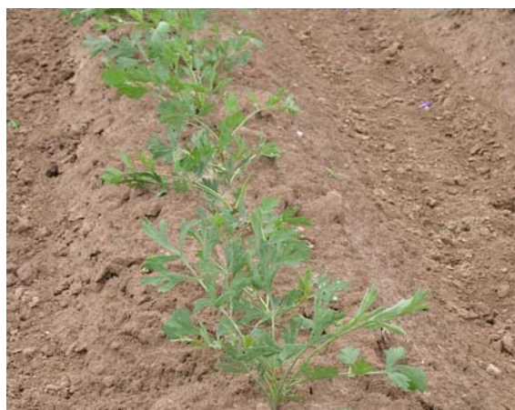
Abb. 6: Gedrillter Bestand im Dammanbau Mitte Juli