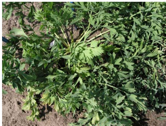
Abb. 2: Rosettenförmiger Wuchs im ersten Jahr

Die Gattung Saposhnikovia Schischk. ist monotypisch und besteht nur aus einer Art Saposhnikovia divaricata (Turcz.) Schischk. Dieses Taxon besiedelt ein weites Verbreitungsgebiet, das sich vom Amurgebiet über die Mandschurei und Mongolei bis Korea und China erstreckt.