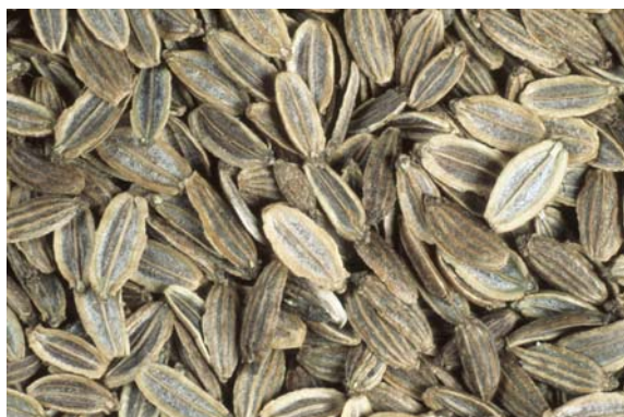
Abb. 1: Die Tausendkornmasse der Samen liegt bei 2,7 bis 4,6 g

hoch) im ersten Jahr. Sie blüht ab dem zweiten Vegetationsjahr ab Mitte Juli mit weißen kleinen Blüten und wird dann 80 bis 110 cm hoch ( s. Titelseite ). Der Stängel ist halbaufrecht und stark verzweigt im Blütenbereich. Der Blütenstand stellt eine Doppeldolde dar. Die Laubblätter sind doppelt oder dreifach gefiedert und 10 bis 15 cm lang.