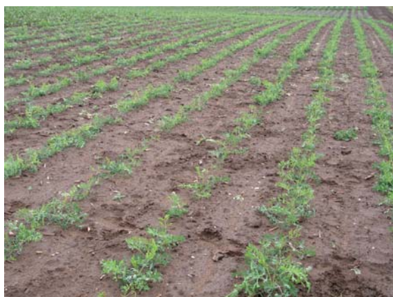
Abb. 5: Gepflanzter Bestand Ende Juni

Die Pflanzung erfolgt maschinell von Mitte bis Ende April in einem Reihenabstand von 42 - 50 cm und einem Abstand in der Reihe von 25 - 30 cm (zirka 80.000 Pflanzen/Hektar). Für einen guten Anwacherfolg müssen die Pflanzen ausreichend durchfeuchtete Wurzelballen aufweisen. Nach der Pflanzung ist bei trockener Witterung unbedingt zu bewässern. Im Hinblick auf die spätere maschinelle Ernte ist auch an einen Beetanbau mit breiteren Fahrspuren und mehreren Reihen pro Beet in Abhängigkeit von der Rodebreite der Erntemaschine zu denken. Vorverfestigte Fahrspuren sichern die Befahrbarkeit auch bei schlechteren Wetterbedingungen und verringern die Bodenverdichtung zwischen den Fahrspuren.