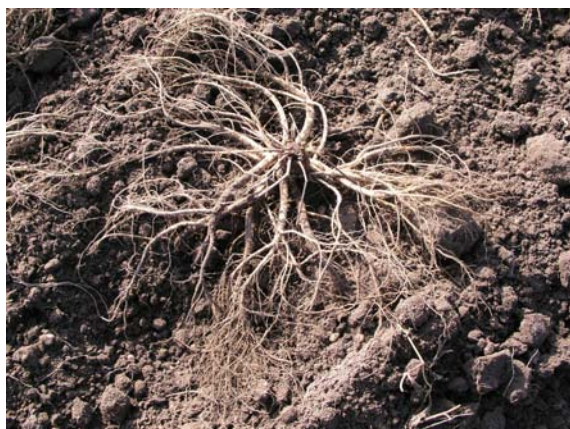
Abb. 8: Einjähriger Wurzelstock aus Pflanzkultur

Die Ernte erfolgt am günstigsten Mitte bis Ende Oktober im ersten Standjahr bei trockener Witterung. Für die leichtere Reinigung sollte der Boden abgetrocknet sein, dies kann bei einem späteren Erntezeitpunkt Probleme bereiten. Vor der Rodung der Wurzeln ist der Entfernung des Krautes größte Aufmerksamkeit zu schenken. Das verwendete Mähwerk oder Schlegelgerät ist exakt einzustellen, um die oberirdischen Teile möglichst vollständig zu entfernen. Die Wurzelernte kann mit Schwingsieb-, Siebketten- oder Rüttelscharroden vorgenommen werden. Die Rodegeräte sollten einen Tiefgang von 30 bis 40 Zentimetern aufweisen.