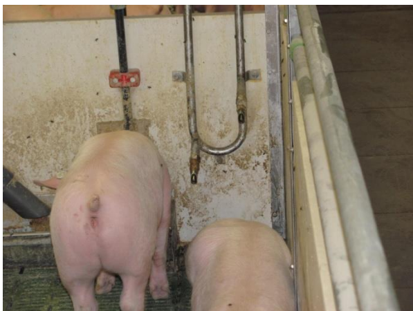
Abb. 4: Nippel-/Trogränke