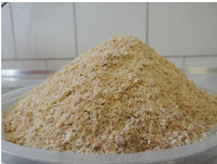
Abb. 1: Kontrollfutter – 30 g Rohfaser, Feinschrot