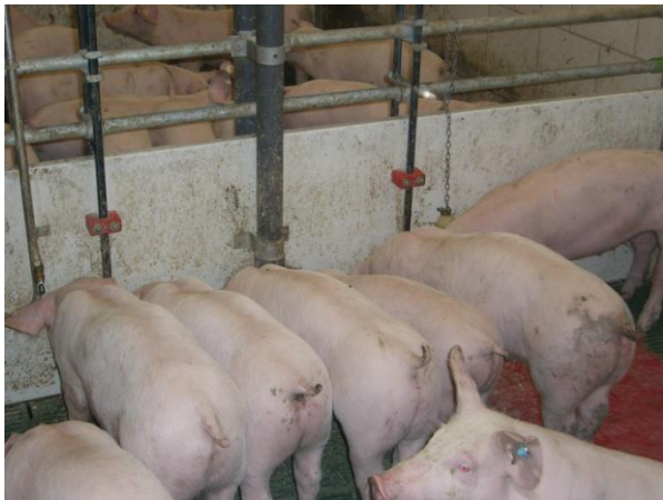
Abb. 3: Gruppenfütterung am Sensor - Langtrog