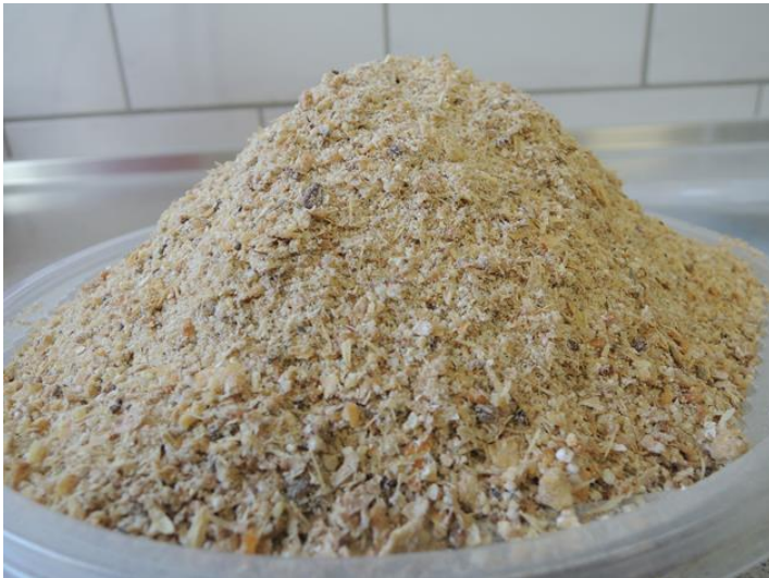
Abb. 2: Testfutter – 50 g Rohfaser, Grobschrot