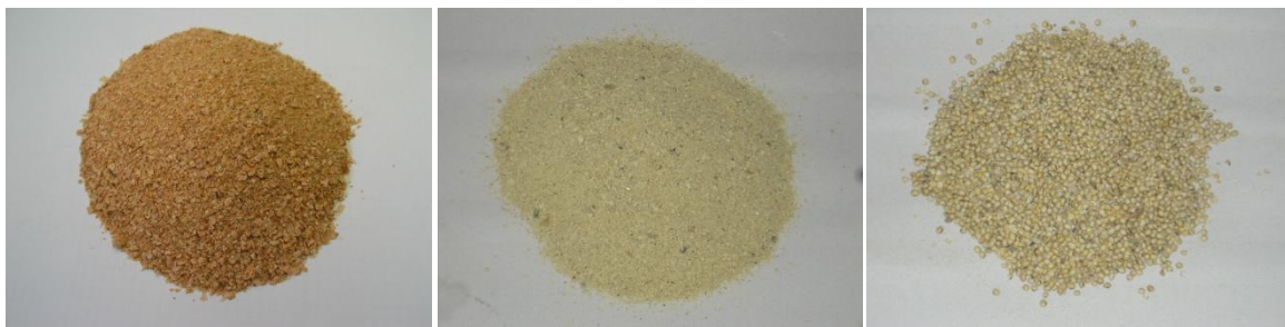
Abb. 1: Sojaextraktionsschrot Sojakuchen, extrudiert Sojabohnen, geröstet