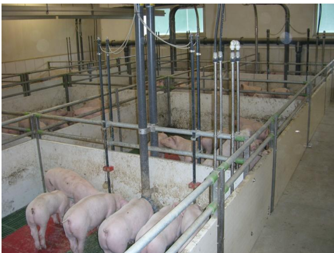
Abb. 2: Gruppenfütterung