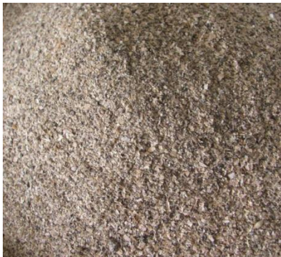
Abb.1: Fasermix für tragende Sauen und Ferkel

Bei den Absetzferkeln mit Wechsel von der hochverdaulichen/hochkonzentrierten Milchnahrung auf feste, unbekannte Pflanzennahrung stehen die Entwicklung der körpereigenen Verdauung und die Stabilisierung der Darmgesundheit im Vordergrund. In der vorliegenden Untersuchung wurde unter dem Aspekt des Tierwohles und der Tiergesundheit der Rohfasergehalt im Ferkelaufzuchtfutter auf 50 g/kg Futter erhöht. Es wird dabei mit einer Mischung aus verschiedenen Rohfaserträgern (Fasermix aus 30 % Apfeltrester, 30 % Rübenmelasseschnitzel, 24 % Sojabohnenschalen, 15 % Weizenkleie und 1 % Rübenmelasse) gearbeitet.