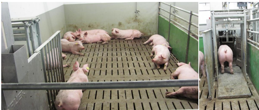
Abbildung 1: Fütterungsversuch an Abrufstationen für Mastschweine

Wertung: Die Ergebnisse sind sehr widersprüchlich auch wenn die durchgängige Vorlage von pelletiertem Futter für die Fütterungstechnik „Abrufstation“ vorteilhaft ist. Bei gleichem Futterverbrauch (= verzehrtes Futter plus Futterverluste/Güllekanalfutter) aber weit niedrigeren