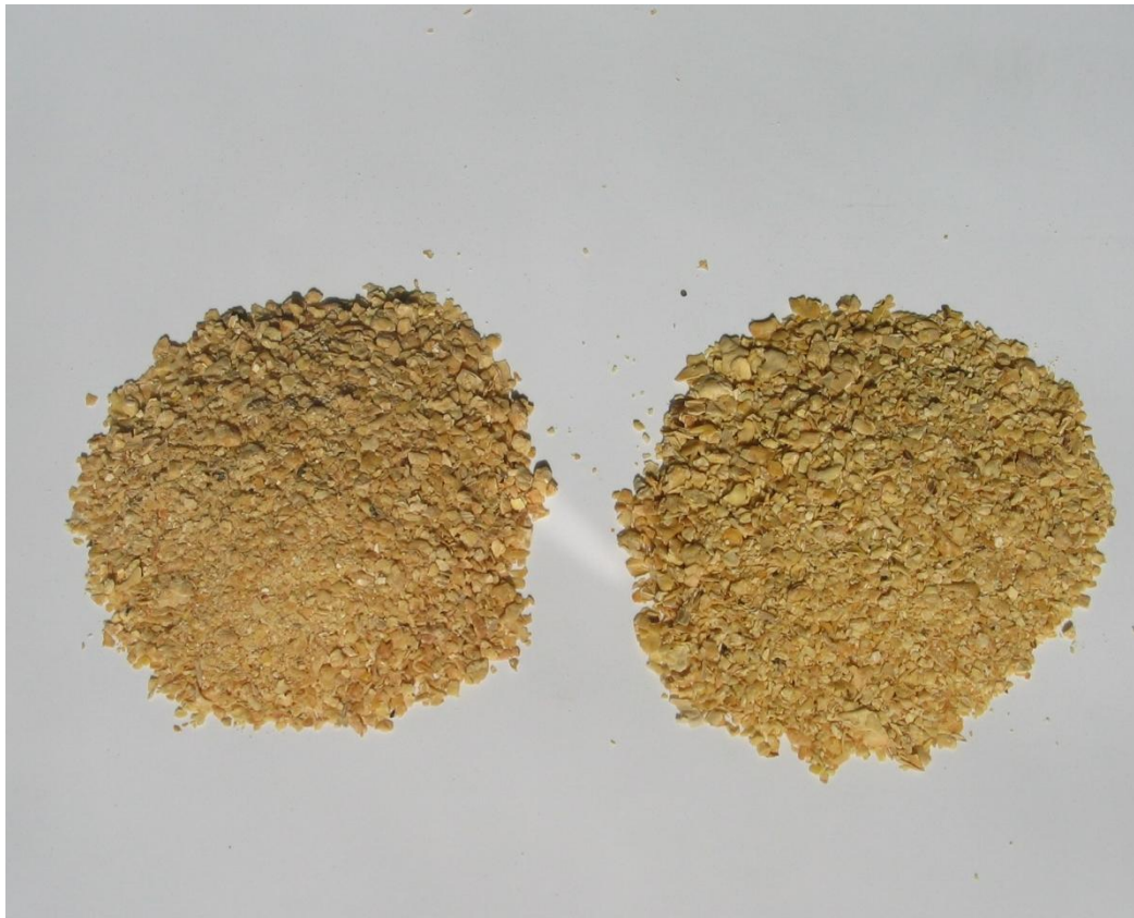
Abb. 2: HP-Überseesoja und Donausoja im Versuch

In 6 Aufzuchtwochen (41 Tage) wurden knapp 32 kg Verkaufsgewicht erreicht. Es wurden 6 „Kümmerer“ vorzeitig aus dem Versuch genommen und nicht bewertet. Die erzielten Leistungen waren anspruchsvoll: