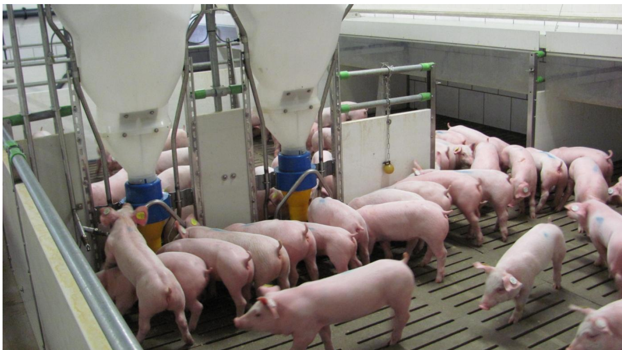
Abb. 1: Gruppenfütterung bei Ferkeln