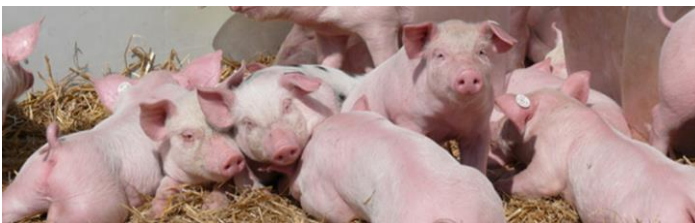
Abb. 4: Unkupierte Schweine in ökologischer Haltung

Die Erblichkeitsschätzwerte für Schwanzverletzungsmerkmale und Schwanzbeißen variierten je nach Merkmal und Entwicklungsstadium von 0 bis 0,22. Die Möglichkeit einer indirekten Selektion auf Basis der Handhabung unter Stress wurde untersucht. Die geschätzten Erblichkeiten für Handhabungsverhalten lagen zwischen 0,19 und 0,28. Die genetischen Korrelationen mit Leistungsmerkmalen waren niedrig. Die Schätzwerte der genetischen Zusammenhänge zwischen dem Handhabungsverhalten und dem Schwanzbeißenverhalten waren wenig konsistent. Die Untersuchung zeigte, dass Genotyp-Umwelt-Interaktionen nicht auszuschließen sind.