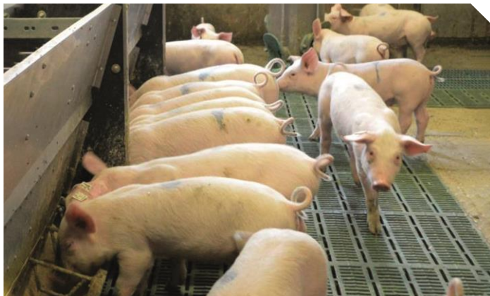
Abb. 1: Haltung unkupierter Tiere