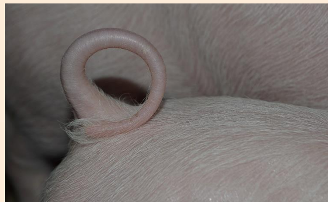
Abb. 2: Unküpirtes Tier