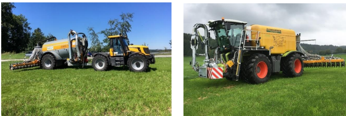
Abb. 11: Die Injektionstechnik (links gezogenes Fass, rechts Selbstfahrer) hat die niedrigsten Ammoniakverluste unter den bodennahen streifenförmigen Techniken.

Nachteilig bei der Gülleinjektion sind der Mehrbedarf an Zugkraft. Aufgrund der im Vergleich zur Breitverteilung, der Schleppschlauch und Schleppschuhtechnik stark begrenzten Arbeitsbreite der Injektionstechnik ist nicht nur die Flächenleistung niedriger, sondern es muss auch mehr Bodenfläche und zudem bei hohem Gewicht ( Abb. 11 ) der Schlitztechnik überfahren werden.