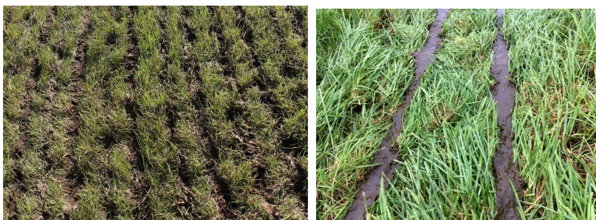
Abb. 17: Auch bei streifenförmiger Ausbringung mit dem Schleppschuh gilt es, die Gefahr von Verschmutzungen zu vermeiden. Zu breite und eng beieinander liegende Streifen (Bild links) oder viel Gülle, noch dazu auf einen zu hohen Bestand (Bild rechts) ausgebracht, lassen die Vorteile bodennaher streifenförmiger Technik schwinden. Dies muss unbedingt vermieden werden. Die beiden Bilder zeigen keine gute fachliche Praxis.

Unterstellt wird häufig, dass bei der Breitverteilung die Verschmutzungsgefahr wesentlich niedriger ist als mit bodennaher Ausbringtechnik. Unbestritten kann die „Optik“ nach der Gülleausbringung mit dem Schleppschuh, insbesondere mit dem Schleppschlauch aber gelegentlich auch bei der Injektion bis hin zur Ernte teilweise „auffälliger“ aussehen als bei der Breitverteilung. Dies vor allem, wenn Gülle bzw. Gärreste nicht optimal ausgebracht werden ( Abb. 17 ). Insbesondere Substrate mit höheren Faseranteilen (Stroh, NaWaRo-Reste) lassen Streifen teilweise bis zur Ernte sichtbar erscheinen.