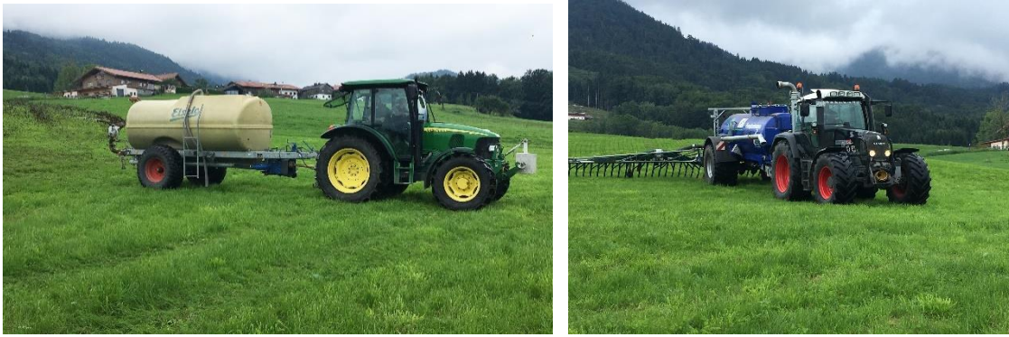
Abb. 18: Durch eine Ausbringung bei bedecktem Himmel, kühlem, feuchten und windstillem Wetter lassen sich Ammoniakverluste stark senken – aber auch bei idealem „Gülewetter“ sind die Emissionen bei bodennaher streifenförmiger Technik (Bild rechts) niedriger als bei Breitverteilung (Bild links)