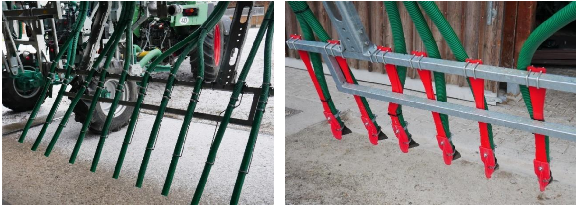
Abb. 3: Unterschied zwischen Schleppschauchtechnik (links) und Schleppschuhtechnik (rechts, hier dargestellt für die Gülleausbringung im Versuchswesen. Schleppschuhe wurden insbesondere für die Ausbringung auf Grünland entwickelt.