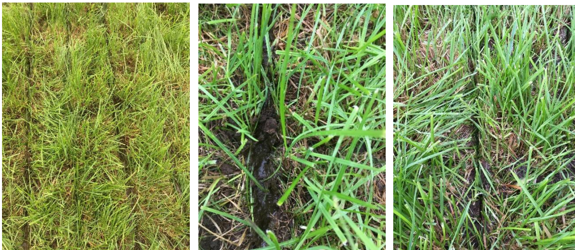
Abb. 10: Bei der Injektionstechnik ist die Gefahr von Futtermittelschmutzungen am geringsten, da der flüssige Wirtschaftsdünger direkt in den Boden eingebracht wird.

Eine Ausbringung in der Hauptvegetationszeit (spätes Frühjahr, Sommer) halten Praktiker in niederschlagsarmen Regionen für deutlich weniger risikoreich in Bezug auf die Futtermittelschmutzung als bei der Schleppschuhtechnik. Zudem werden Faserstoffe direkt in den Boden eingebracht und verbleiben nicht als potenzielle Verschmutzungsquelle auf der Bodenoberfläche.