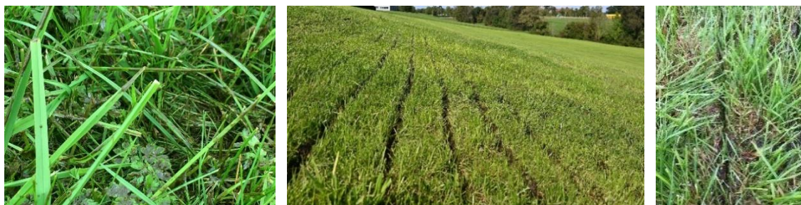
Abb. 2: Wesentlich verantwortlich für die Höhe der Ammoniakemissionen nach der Ausbringung ist die Kontaktfläche zwischen Wirtschaftsdünger und Luft. Sie ist bei Breitverteilung (Bild links) um ein Mehrfaches höher als bei bodennahe streifenförmiger Ausbringtechnik (Bild Mitte) oder gar Injektion (Bild rechts). Daher sind bei sonst gleichen Bedingungen (z.B. Witterung, TS-Gehalt, Boden, Pflanzenbestand) die \text{NH}_3 -Verluste bei Breitverteilung nachgewiesener Weise deutlich höher.

Die gegenüber der Breitverteilung erreichbare Emissionsminderung nimmt dabei in der Reihenfolge Schleppschlauch, Schleppschuh, Injektion zu (siehe auch Kapitel 6).