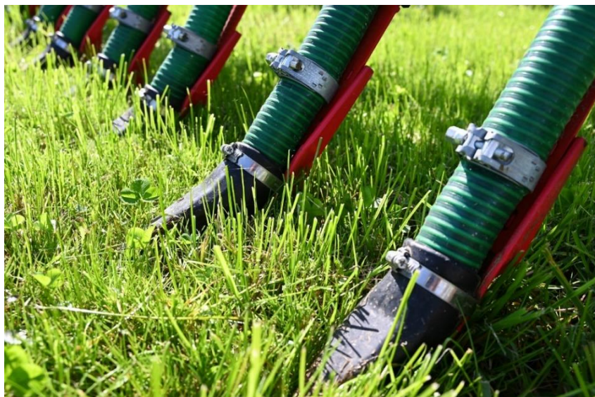
Abb. 5: Ziel beim Schleppschuh: Scheiteln des Pflanzenbestands und Ablage des flüssigen Wirtschaftsdüngers auf den Boden bzw. in den durch die Kufen leicht angeritzten Boden.

Insbesondere ist dies bei schon etwas angewachsenen Beständen der Fall. Dadurch können gegenüber der Schleppschlauchtechnik, jedoch insbesondere gegenüber der Breitverteilung die Ammoniakverluste in die Atmosphäre stark reduziert werden.