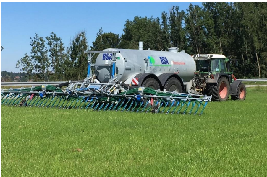
Abb. 1: Bodennahe streifenförmige Ausbringverfahren (hier Schleppschuh) von flüssigen Wirtschaftsdüngern sind für die notwendige Minderung der Ammoniakemissionen aus der Landwirtschaft unverzichtbar!

Da in Deutschland derzeit rund 92 % der Ammoniakemissionen aus der Landwirtschaft stammen, steht dieser Sektor unter besonderem Anpassungsdruck. Dabei sind die anfallenden Wirtschaftsdünger (Gülle, Mist, Jauche, aber auch Gärreste aus Biogasanlagen) die größte Emissionsquelle. Verluste treten im Stall, während der Lagerung sowie beim Ausbringen von Wirtschaftsdüngern auf und müssen soweit wie möglich reduziert werden. Für die Zielerreichung der NEC-Richtlinie sind somit umfangreiche Maßnahmen auf möglichst allen Stufen (Stall, Lager, Ausbringung) sowie eine Kombination der Maßnahmen notwendig.