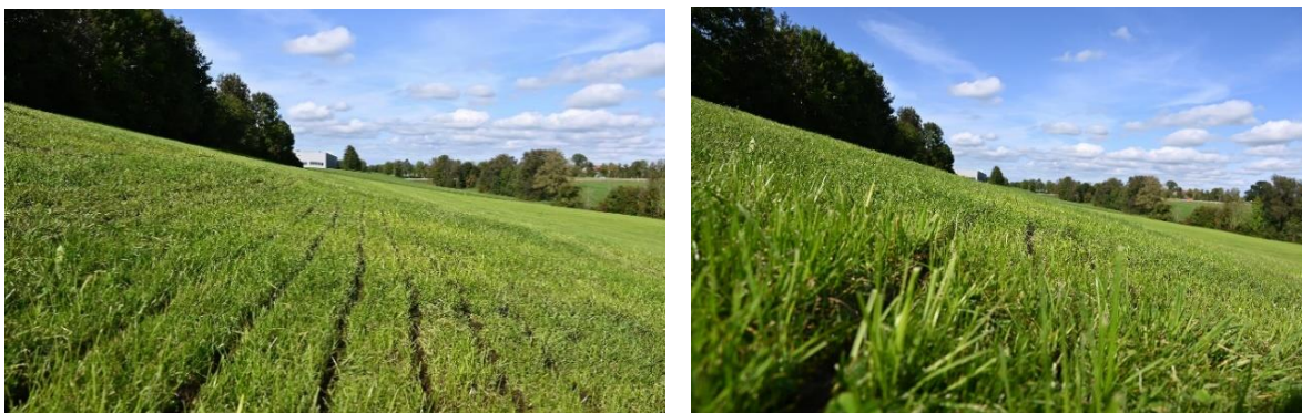
Abb. 6: So sollte Schleppschuheinsatz aussehen – schmale Streifen (Bild links) und Ablage unter den wiederangewachsenen Pflanzenbestand (Detailbild rechts) – mit der entsprechenden Technik und Erfahrung ist dies auch in Hanglagen möglich

Empfehlenswert sind daher spezielle schmale Grünlandkufen in Kombination mit einem optimalen Schardruck ( Abb. 7 ), um den Pflanzenbestand zu teilen und die Güllebänder sauber am Boden abzulegen und diesen evtl. sogar etwas anschlitzten.