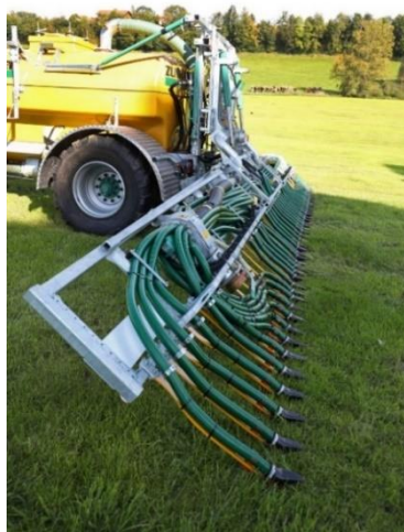
Abb. 7: Die Abstimmung von erzielbarem Auflagedruck der Kufen sowie die Ausformung der Kufen selbst spielen für die Vermeidung von Futtermverschmutzungen eine wichtige Rolle.

Breitere Schleppschuhkufen hingegen erhöhen die Möglichkeit, dass die Pflanzen anteilig mehr niedergedrückt werden und sich daraus ein höheres Potenzial für Verschmutzungen durch Güllereste ergibt. Diese Einflussfaktoren sollten bei einer Anschaffung der Technik berücksichtigt werden.