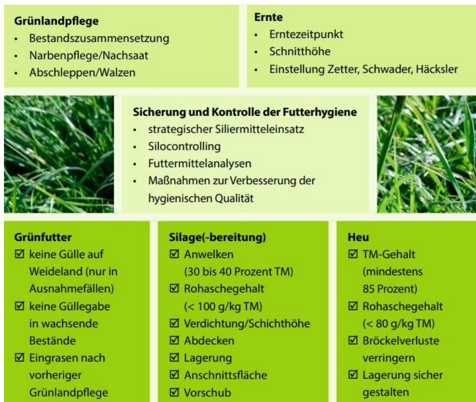
Abb. 14: Wichtige Maßnahmen zur Gewinnung von hochwertigem Futter aus Gras – die Grünlandpflege und eine optimale Ernte sind dabei entscheidende Ausgangspunkte