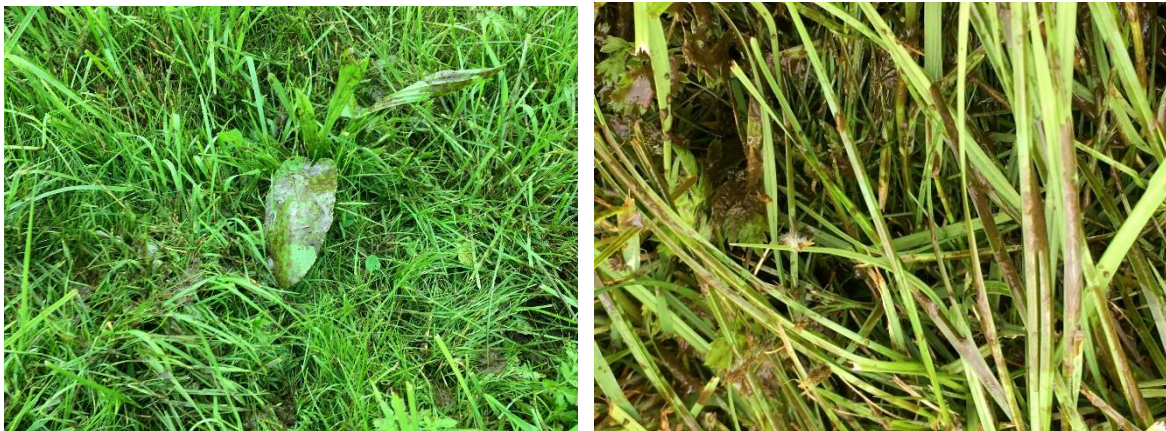
Abb. 16: Bei Breitverteilung wird die gesamte Oberfläche benetzt. Ist der Bestand schon angeschoben, weil z.B. nicht kurz nach der Ernte begüllt werden kann, gelangt Gülle auch auf die Pflanzen. Bleibt kräftiger Regen in den nächsten Stunden aus, so geht nicht nur viel Stickstoff in die Luft, sondern es besteht auch die starke Gefahr, dass Güllereste in das Futter gelangen.

Bis dato ist u.a. im süddeutschen Raum mitunter noch eine große Skepsis gegenüber der bodennahen Technik vorhanden. Dies hat nicht nur betriebswirtschaftliche Gründe, wobei die Anschaffungskosten vor allem bei Schlepplandverteilern und viel mehr noch bei der Injektionstechnik unbestritten deutlich höher sind als bei der Breitverteilungstechnik. Vorbehalte bzw. Verunsicherung bestehen aber auch in Hinblick auf die erzielbare Futterqualität. Die bandförmige Ablage von Gülle/Gärresten bewirkt, dass die hier enthaltenen Feststoffe, konzentrierter (ca. 4-5fach) auf der Futterfläche zurückbleiben und verkrusten können. In besonders ungünstigen Fällen können diese bandförmigen Faserreste bei der Ernte in das Futter gelangen, gerade wenn die Erntetechnik nicht optimal ist.