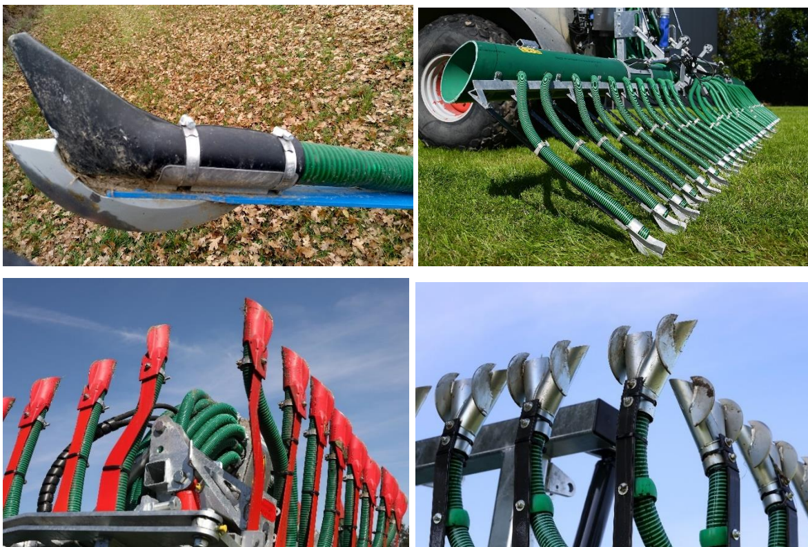
Abb. 4: Schleppschuhtechnik ist im Detail unterschiedlich. Hier sind als Beispiel verschiedene Systeme dargestellt, die sich z.B. in der Ausprägung der Kufen deutlich unterscheiden und damit teilweise auch deutlich im Verteilbild.

Die am Schlauchauslauf angebrachten Werkzeuge bewirken ein Scheiteln bzw. Öffnen der Grasnarbe, so dass die Gülle direkt auf den Boden bzw. in den leicht angeritzten obersten Bodenbereich abgelegt wird. Anschließend schließt sich der Bestand wieder, wodurch der Luftkontakt und die Einstrahlung – und damit auch die Ammoniakemissionen - verringert werden ( Abb. 5 ).