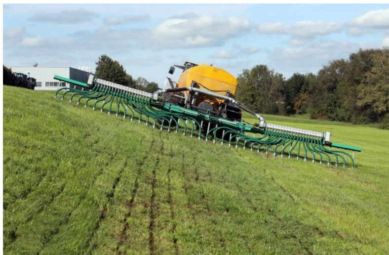
Abb. 12: Gerade in Hanglagen werden erhöhte Anforderungen an die Technik gestellt, um die Gülle sauber an den Boden zu bekommen.

Schon heute bieten Firmen für erschwerte Bedingungen (Hanglagen, enge Hofstellen) kleine leichte Fässer oder vergleichsweise günstige Umbaulösungen an. Auch erfolgreiche Eigenkonstruktionen und pfiffige Umbaulösungen sind bereits im Einsatz. Emissionsarme Technik ist daher keineswegs ( Abb. 13 ) stets in Zusammenhang mit großen, schweren Fässern bzw. entsprechenden Zugmaschinen zu sehen.