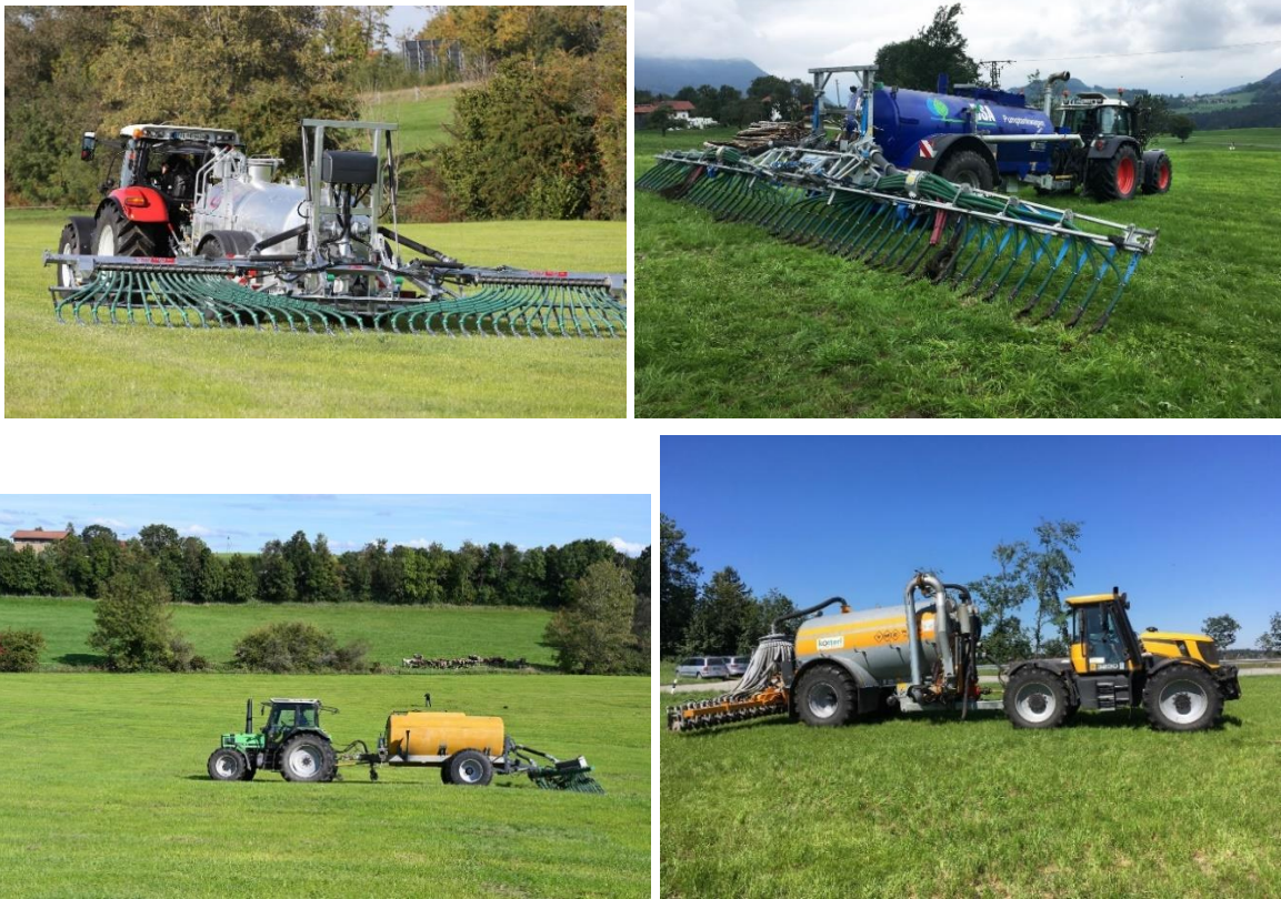
Abb. 13: Welche Technik für welchen Betrieb am besten passt, hängt von vielen Details ab. Dabei bedeutet emissionsarme Gülleausbringung keineswegs automatisch sehr große und schwere Technik!

Die ideale Lösung für die Zukunft wäre, dass einem Betrieb je nach Boden- und Witterungssituation abrufbereit beide Techniken (Schleppschuh bzw. Injektion) zur Verfügung stünden. Dies erfordert die Kombination von Eigenmechanisierung unter flexibler Einbeziehung von Maschinengemeinschaften oder Lohnunternehmern. Die Entwicklung betriebsoptimaler Konzepte im Wirtschaftsdüngermanagement schließt, neben agrarstrukturellen Gegebenheiten und finanziellem Spielraum, auch lokale Witterungsverhältnisse, welche nochmals spezielle Anforderungen an den optimalen Technikeinsatz stellen, sowie die Berücksichtigung betriebsspezifischer Substrateigenschaften des Wirtschaftsdüngers (TS-Gehalt, Fließfähigkeit, Faseranteile) mit ein.