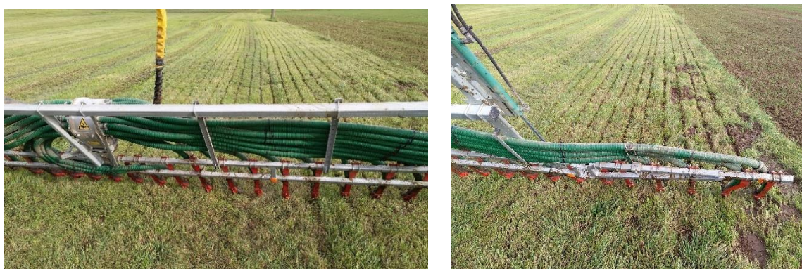
Abb. 15: Im Prinzip ist hier die Gülle sauber mit dem Schleppschuh unter den Bestand abgelegt (Bild links). Was aber ein Problem bei der Ernte und Konservierung sein kann, sind offene Bodenstellen (Bild rechts). Werden die Mäh- und Erntegeräte nicht genau darauf eingestellt und gelangt Boden in das Futter, kommen damit auch Clostridien ins Futter und die Gefahr einer nicht optimalen Silage ist gegeben.

Daher sind Erdhaufen und offene Bodenstellen ( Abb. 15 ) ein nicht zu unterschätzendes und zu vermeidendes Kontaminationspotenzial. Lücken in der Grasnarbe bzw. offene Bodenstellen im Bereich der Zufahrtsbereiche oder Vorgewende in Hinblick auf die Clostridienbelastung können zum Teil problematischer als die Gülledüngung sein. Dies vor allem, wenn das Gras zu tief geschnitten wird. Daher sollte gerade bei lückigeren Grünlandbeständen die Schnitthöhe stets mehr als 7 cm betragen. Weitere Vorteile eines höheren Schnitts sind ein schnellerer Wiederaufwuchs.