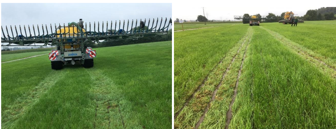
Abb. 8: Ist das Gras schon länger und der Boden nass, ist auch bei Schleppschuhtechnik Vorsicht geboten. Nicht zwangsläufig treten Probleme in Fahrspuren auf (Bild links), kommt es jedoch zu einem Niederwalzen des Bestands in der Fahrspur, durchdringt der Schuh nicht die Grasnarbe (Bild rechts) und ist zudem die Güllemenge auch noch zu hoch, so sind Probleme vorprogrammiert

Dies reduziert die Anfälligkeit für Futtermittelverschmutzung durch Güllebänder enorm. Trocknen die abgelegten Güllebänder dagegen zu schnell ab, können diese im Bestand mit nach oben wachsen und auch von nachfolgenden Niederschlägen oder den Bodenlebewesen nur schwer zersetzt werden.