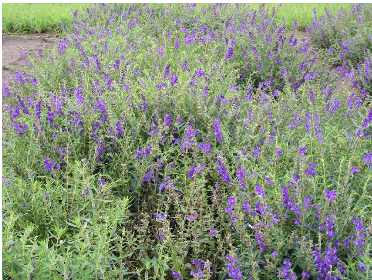
Abb. 6: Blühender einjähriger Bestand im August mit leichtem Krankheitsbefall

Laufe der Kulturdauer der Beregnungseinsatz sehr empfehlenswert (insbesondere bei einem Dammanbau).