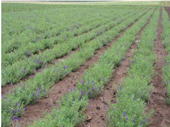
Abb. 4: Gepflanzter Bestand Anfang Juli

Die Pflanzung erfolgt maschinell von Mitte bis Ende April in einem Reihenabstand von 42 - 50 cm und einem Abstand in der Reihe von 25 - 30 cm (zirka 80.000 Pflanzen/Hektar). Für einen guten Anwacherfolg müssen die Pflanzen ausreichend durchfeuchtete Wurzelballen aufweisen. Nach der Pflanzung ist bei trockener Witterung unbedingt zu bewässern. Im Hinblick auf die spätere maschinelle Ernte ist auch an einen Beetanbau mit breiteren Fahrspuren und mehreren Reihen pro Beet in Abhängigkeit von der Rodebreite der Erntemaschine zu denken. Vorverfestigte Fahrspuren sichern die Befahrbarkeit auch bei schlechten Wetterbedingungen und verringern die Bodenverdichtung zwischen den Fahrspuren.