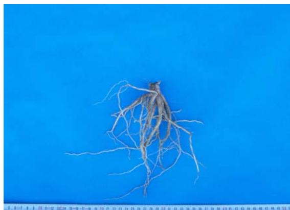
Abb. 2: Einjährige Wurzel von Scutellaria baicalensis

Die Gattung Scutellaria umfasst etwa 350 Arten. Scutellaria baicalensis kommt in China, Japan, Korea, Russland und in der Mongolei vor.