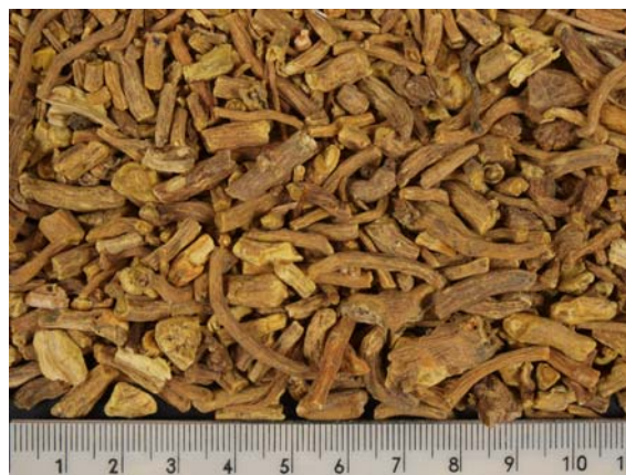
Abb. 10: Wurzel Droge aus bayerischem Feldanbau