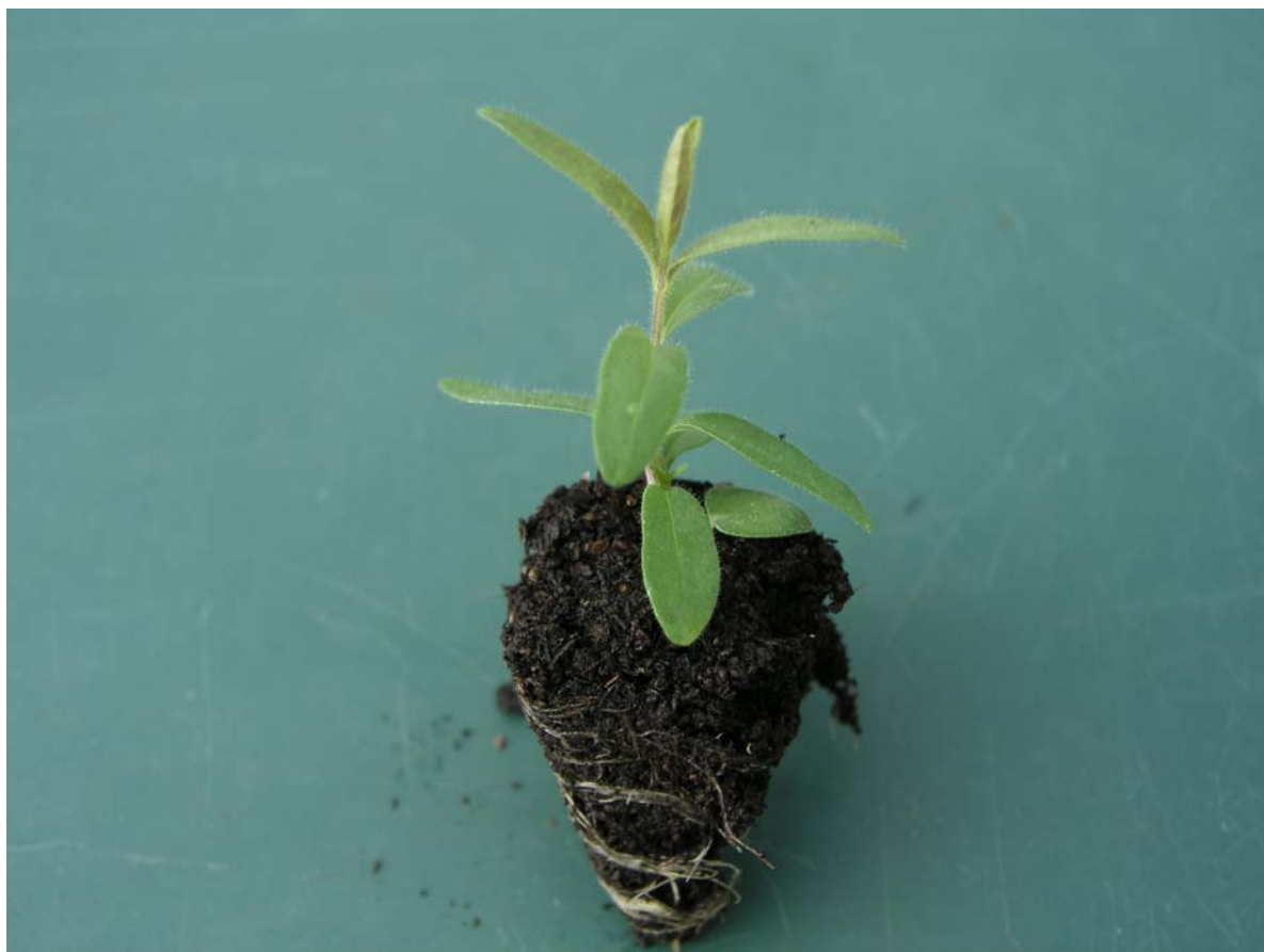
Abb. 3: Gut entwickelte, pflanzfertige Jungpflanze von Scutellaria baicalensis

Gut bewährt für das Pikieren haben sich die Vefi-Zapfencontainer mit einem oberen Durchmesser von 3,2 cm. Die 40 x 60 Zentimeter großen Platten enthalten 160 Container. Etwa zwei Wochen nach dem Pikieren kann mit dem Nachdüngen in einer Konzentration von 0,1 % eines stickstoffbetonten Volldüngers begonnen werden. Kurz vor der Pflanzung sollte eine 0,3 %ige Startdüngung vorgenommen werden. Weder während der Anzucht noch nach der Pflanzung sollten Wachstumsstockungen auftreten, da diese zu gedrehten und schlecht zu reinigenden Wurzeln führen können.