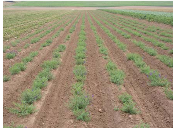
Abb. 5: Gedrillter Bestand im Dammanbau Mitte Juli