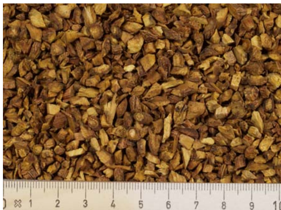
Abb. 9: Traditioneller Schnitt bei chinesischer Importdroge

Nach der Trocknung ist die Droge geschützt vor Feuchtigkeit (auch Luftfeuchte!), Licht und Lagerschädlingen, zum Beispiel in Papier-, Jute- oder Kunststoffsäcken, aufzubewahren.