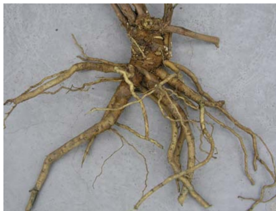
Abb. 8: Wurzelstock aus Pflanzkultur

In den Versuchen konnten die in Tabelle 2 dargestellten Erträge in Abhängigkeit von Anbauverfahren und -dauer ermittelt werden. Das Eintrocknungsverhältnis (EV) zwischen Frischware und Droge bewegte sich im ersten Standjahr zwischen 2,4 und 2,5 sowie im zweiten Jahr zwischen 2,1 und 2,5. Die häufig niedrigeren Erträge des Pflanzverfahrens sind auf krankheitsbedingte Ausfälle nach der Jungpflanzenanzucht zurückzuführen. Bei der Drillsaat auf das Feld wurde ein deutlich geringerer Krankheitsbefall festgestellt. Als Faustzahl kann man in der Praxis von durchschnittlich 7 dt Wurzeldroge pro Hektar nach einer