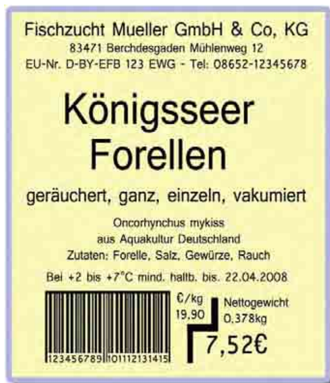
Abb. 2: Kennzeichnungsbeispiel für vorverpackte Ware (Fertigpackung)