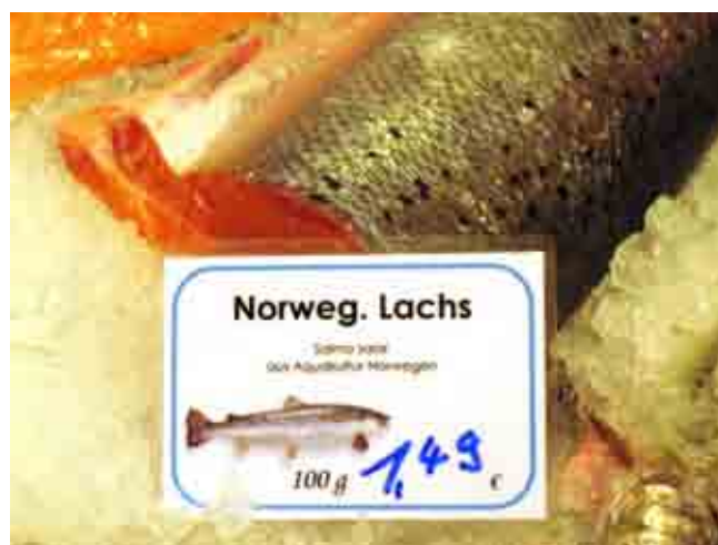
Abb. 3: Kennzeichnungsbeispiel Fischtheke