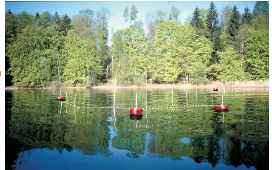
Großreuse/Trappnetz: Die orangenen Bojen kennzeichnen die Lage der Reuse.