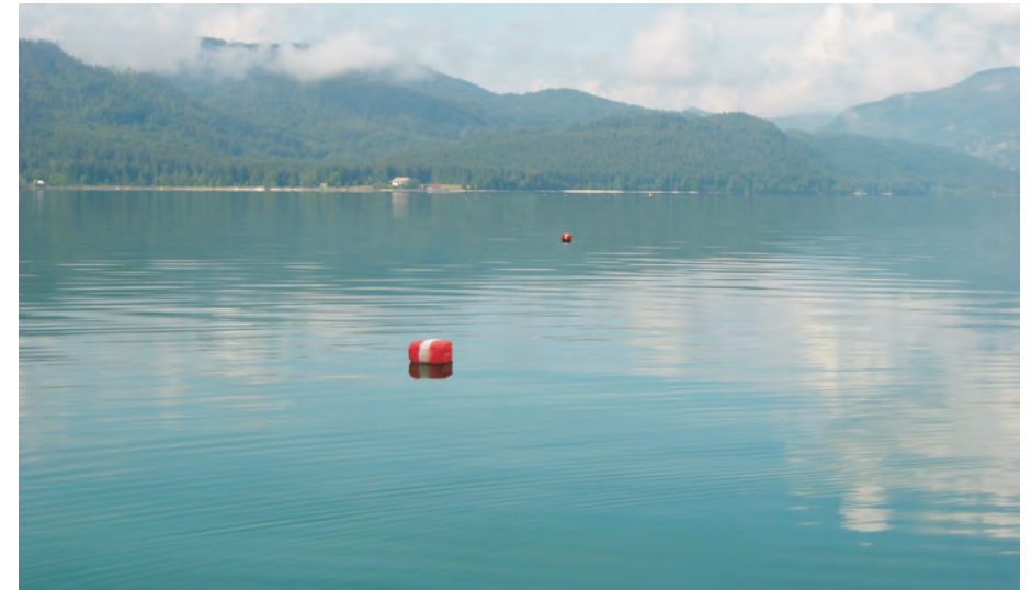
Ufernahes Stellnetz: Die orangenen Bojen kennzeichnen die beiden Netzenden.