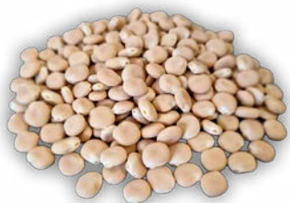
Die vielseitig einsetzbaren Körner sollten möglichst wenig Alkaloide enthalten

teil im Mischfutter für Nutztiere und als vielseitiges Lebensmittel. Der hohe Eiweißgehalt von bis zu 45 % und die hochwertige Zusammensetzung der Aminosäuren ist gleichwertig mit der Sojabohne. Aus Lupinenkörnern werden beispielsweise diverse