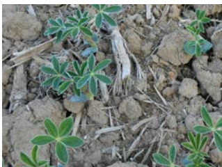
Jungpflanzen der Weißen Lupine Mitte Mai

Die Weiße Lupine wächst am besten auf mittelschweren Böden (sandiger Lehm – schluffiger Lehm) bei einem pH-Wert von 5,5 bis 6,8 . Sie keimt bereits bei Temperaturen um +3 Grad, weshalb sie ab Mitte März mit einer Dichte von 55 bis 75 Körnern/m 2 in einer Saattiefe von 3 bis 4 cm ausgesät wird. Zur Keimung sowie zur Blüte hat die Weiße Lupine einen hohen Wasserbedarf, allgemein gilt sie allerdings aufgrund ihrer tiefen Pfahlwurzel als trockenheitsverträglich. Die Körner werden vor der Aussaat mit einem Rhizobien-Präparat beimpft , um eine optimale Knöllchenbildung sicherzustellen.