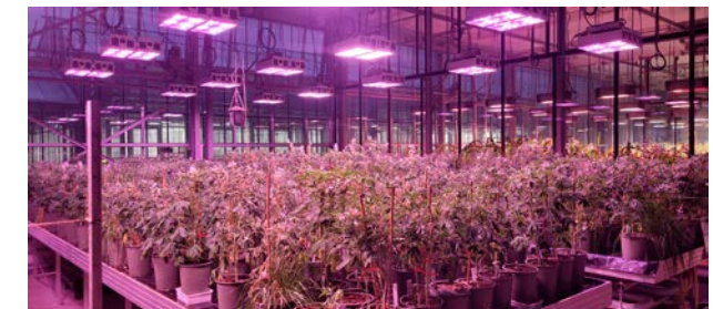
Gefäßversuch der LfL zur Untersuchung verschiedener Einflussfaktoren auf den Alkaloidgehalt

Um die Weiße Lupine als wertvolle Kultur in der bayerischen Landwirtschaft zu unterstützen, prüft die LfL zugelassene Sorten in Landessortenversuchen , erarbeitet Optimierungen in der Produktionstechnik und unterstützt die Entwicklung angepasster Sorten durch grundlegende Züchtungsarbeit .