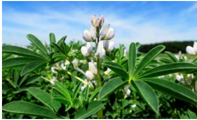
Weiße Lupine in der Blüte

Als Körnerleguminose bietet die Weiße Lupine vielfältige Vorteile in der Fruchtfolge. Sie wirkt durch ihr starkes Wurzelsystem bodenlockernd , bindet Stickstoff durch die