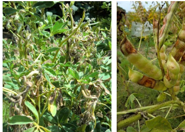
Anthraknose-Befall: verdrehte Triebe zur Blütezeit und Brennflecken an Hülsen

Die aktuell bedeutendste Pilzkrankheit bei Lupinen ist die Brennfleckenkrankheit, verursacht durch den Pilz Colletotrichum lupini . Der Erreger ist samenbürtig, jedoch sind nicht immer Verfärbungen am Korn erkennbar. Die Infektion kann sich, insbesondere bei feuchter Witterung, epidemisch auf den gesamten Bestand ausbreiten und bis zum Totalausfall führen. Es sind keine effizienten Pflanzenschutzmittel für die Bekämpfung zugelassen. Seit 2019 gibt es zugelassene Sorten, die moderat anthraknosetolerant sind. Geschützte Sorten sind für den Nachbau verboten , wobei dieser aufgrund des dann erhöhten Risikos für Anthraknose nicht zu empfehlen ist.